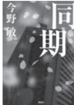
『同期』 こんの びん 今野 敏/著 講談社

警視庁捜査一課の刑事に異動した宇田川亮太は、公安に異動した同期の蘇我和彦と再会する。探りたいことがあって、蘇我と食事を共にするが、数日後彼が懲戒免職になったことを知る。そのうえ殺人の容疑者になっていた。友を案じる宇田川に壁は厚い。