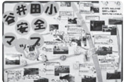
県教育長賞を受賞した谷井田小学校の安全マップ（関連ページ10P）

最近、青色灯のパトロール車を見かけませんか？これは、市職員をはじめ、防犯協会、学校関係者などが、さまざまなボランティア団体の皆さんと、地域の防犯のためにパトロールを実施しているのです。この青色には、犯罪抑止効果があるといわれています。