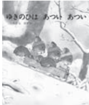
『ゆきのひは あつい あつい』 いわむら かずお/作 至光社

警視庁捜査一課の刑事に異動した宇田川亮太は、公安に異動した同期の蘇我和彦と再会する。探りたいことがあって、蘇我と食事を共にするが、数日後彼が懲戒免職になったことを知る。そのうえ殺人の容疑者になっていた。友を案じる宇田川に壁は厚い。