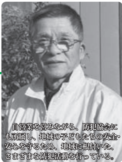
自営業を営みながら、防犯協会にも所属し、地域の子どもの安全を守るため、地域に根付いた、さまざまな防犯活動を行っている。

犯の輪を広げることがとても大切です。こうした運動を成功させるポイントは、「無理をせず、できることから」だと思います。日常のあいさつ、散歩、買い物ときでも犯罪者を寄せ付けない「人の目」を意識するだけで、犯罪者が接近しにくい効果があるといえます。