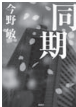
『同期』 今野敏/著 講談社