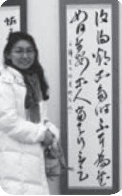
今回の入選は、師匠のご指導、家族の応援があったからだと思います。将来は書家を目指して、これからも頑張ります。

「書は書いている人の心まで写し出すものだから。ここに書の醍醐味がある。」と語る中谷さんから、書の奥深さが伝わってきました。