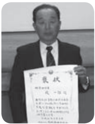
堤さんは、昭和52年に旧伊奈町体育協会理事となり、その後、副会長・会長職を歴任し、町村合併後はつくばみらい市体育協会初代会長に選任され、永きにわたり当市スポーツ活動の振興・発展に尽力されました。おめでとうございます。

町体育協会理事となり、その後、副会長・会長職を歴任し、町村合併後はつくばみらい市体育協会初代会長に選任され、永きにわたり当市スポーツ活動の振興・発展に尽力されました。おめでとうございます。