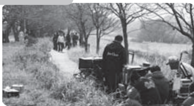
ロケ地：福岡堰（福岡）

幕末の江戸へタイムスリップしてしまった、脳外科医・南方仁（大沢たかお）が、満足な医療器具や薬もない環境で人々の命を救っていく。その中で、仁の世話をし、支えになる橋本（綾瀬はるか）と出会い、自分も時代の渦に巻き込まれていく。