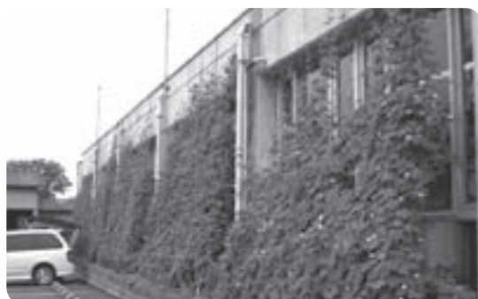
温室効果ガス削減のため、昨年夏にはグリーンカーテンを実施しました。（写真は谷和原庁舎）

温室効果ガス削減のために策定した本計画では、平成17年度を基準年度とし、23年度までにおおむね3割削減することを目標としています。