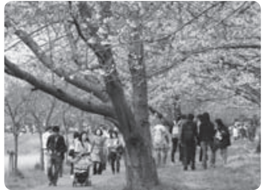
昨年のさくらまつりの様子

共交通機関をご利用ください。また、場内でのバーベキューは禁止です。さらに、飲酒運転は「絶対」