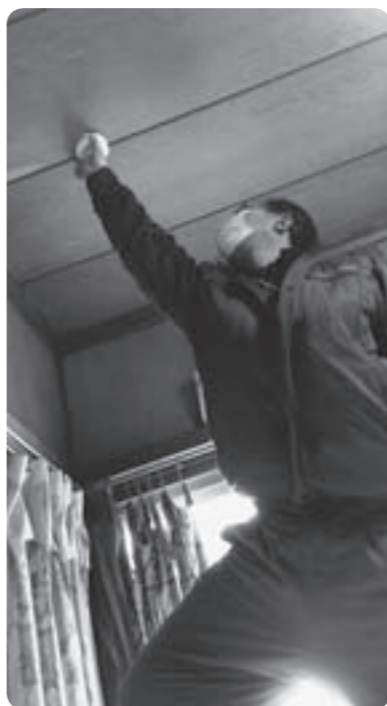
市内業者の方が設置に協力してくださいました

のような恩恵を受けることができて、とてもありがたい。今回、火災報知器を設置していただいたことを機に、あらためて火災には注意したい。」と安堵の様子を浮かべていました。