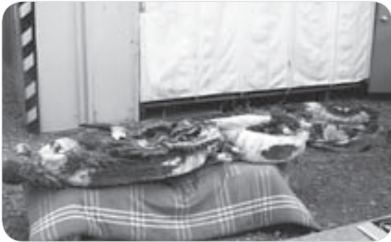
取り外された龍の彫刻

「相談窓口」市消費生活センター（谷和原庁舎1階） 月～金曜 午前9時～正午 午後1時～4時30分 休25・3288