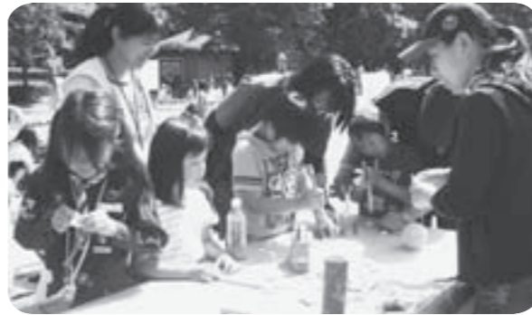
▷竹で何ができるのかな？

天候にも恵まれた6月5日、市社会福祉協議会主催の第5回子ども祭りが、きらくやまふれあいの丘で開催されました。会場では、竹でいろいろな物をつくる竹細工コーナーや、バリンアートで好きな動物を作る、ビニールロケットを作るといった創作体験コーナーが設けられたほか、野外ステージでは、ビンゴ大会などが盛大に行われ、子どもたちの笑顔をあちこちから見るのができました。