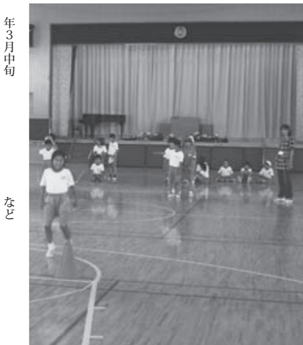
風船を使った班対抗リレーの様子