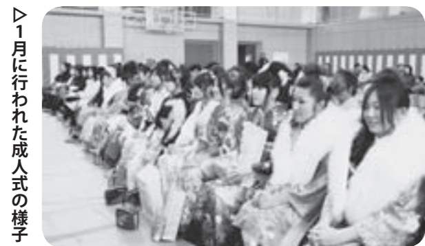
▶1月に行われた成人式の様子