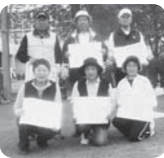
入賞された皆さん

第8回市ブランド・ゴルフ大会が、5月15日、市総合運動公園園野球場で開催されました。大会には、男子の部57人、女性の部39人が参加し、日頃の練習の成果を発揮すべく、一打一打集中し、狙いを定めていました。成績は次のとおりです。