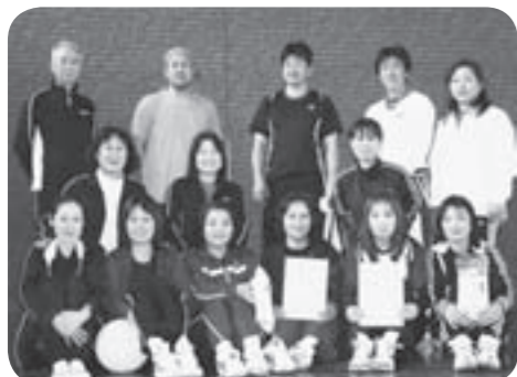
▷各グループで優勝・準優勝した皆さん

【ひばりグループ】 優勝 T・M・Cチーム 【なのはなグループ】 準優勝 T M レディースチーム