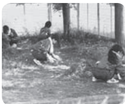
▷除草作業に取り組む生徒たち

3年1組の生徒たちは、市伊奈給食センター内の除草作業や袋詰めされた残飯を処分する作業も手伝いました。当日は、強い日差しの中、額に汗をかきながら、日頃の感謝の気持ちを込めて作業にあたっていました。生徒からは「ボランティアをして、