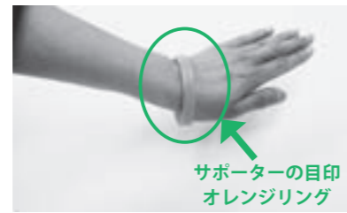
サポーターの目印 オレンジリング

認知症は、誰でも起こりうる脳の病気です。身近な方の理解やちょっとした手助けがあれば、穏やかに住み慣れた自宅での生活を続けることができます。しかし、そのためには地域の皆さんの支えが必要です。誤解されていることが多い認知症のことを、この機会にまずは正しく知ることから始めてみましょう！そして、あなたの地域を温かく見守り「認知症になっても安心して暮らせるまち」を、みんなと一緒に作っていきましょう。