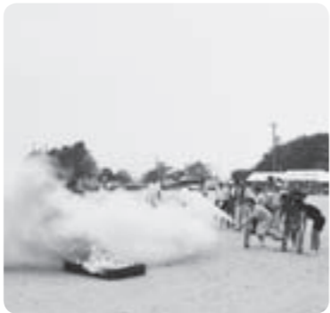
昨年の消火訓練の様子

防災訓練は、災害が発生したときに落ち着いて的確な行動がとれるように習熟しておくとともに、日ごろの防災の備えを点検・検討する重要な機会です。 市では、災害の発生時に迅速な初動体制の確立と的確な応急対策が講じられるよう、市民の皆さんご参加のもと、地震・風水害を想定した実践的な防災訓練を予定しています。