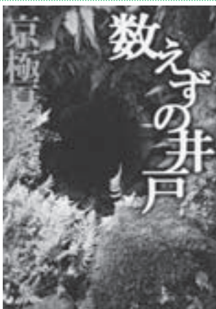
『数えずの井戸』 きょうこく なつひこ 京極 夏彦 / 著 中央公論新社

怪談の定番「番町皿屋敷」の言い伝えの真偽説を序に置いて、「昔数え 数えずの娘」から「皿数え 数えずの井戸」まで、皿屋敷外伝の様な十一の短編が並ぶ。暑い夏、一編ずつ涼しさを味わえそう。