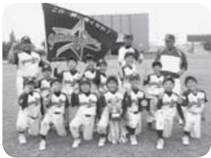
準優勝した谷井田スターズの皆さん

全62チームが参加する中、本市から参加の「谷井田スターズ」が、日頃の練習の成果を思う存分発揮し、見事、準優勝に輝きました。