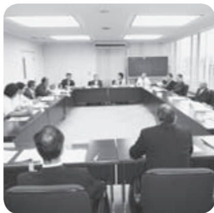
義務教育施設適正配置審議会の様子

平成20年4月に公立小中学校の適正規模についての指針が、次のように茨城県教育委員会より示されました。 ①小学校においては、クラス替えが可能である各学年2学級以上となる12学級以上が望ましい。 ②中学校においては、クラス替えが可能で全ての教科の担任が配置できる9学級以上が望ましい。