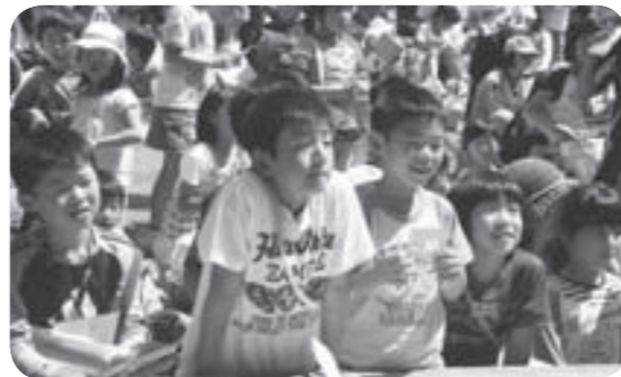
▷あつひつでビンゴだ！

当日、ご協力いただいた各団体は次のとおりです。ご協力ありがとうございました。 ・おもちゃ病院ビノキオ ・骨髄バンクを支援するいばらきの会 ・板橋、東、三島、豊、小絹、小張、谷井田子ども会 ・ボランティア連絡協議会 ・民生委員児童委員協議会 ・高校生会、高校生会OB ・読み聞かせ「虹の会」 ・ボーイスカウト(取手第3団) ・茨城みなみ農業協同組合 ・つくばみらい市消防署