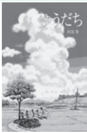
『ゆうだち』 あべ はじめ 阿部 肇 / 作・絵 ポプラ社

一年生のゆうたは、やってきた夕立ちに置き忘れられたまっかちん(真つ赤な大きなザリガニ)のパケツを、みんなが逃げ込んだ秘密基地に運んだ。もちろんびしょぬれ。でも、そのごほうびに...。親子で思い出を楽しめる絵本。