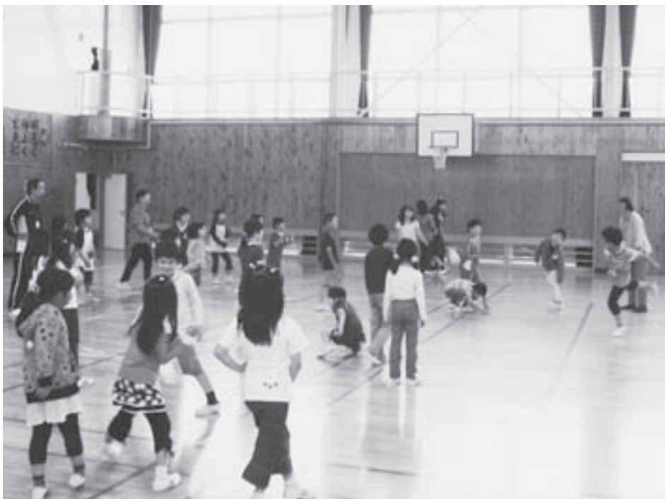
学年別班対抗ドッジボールの様子