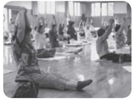
生き生きクラブの様子

市介護福祉課では、生き生きクラブ、長・楽・部などの介護予防策を通し、介護予防に取り組んでいます。