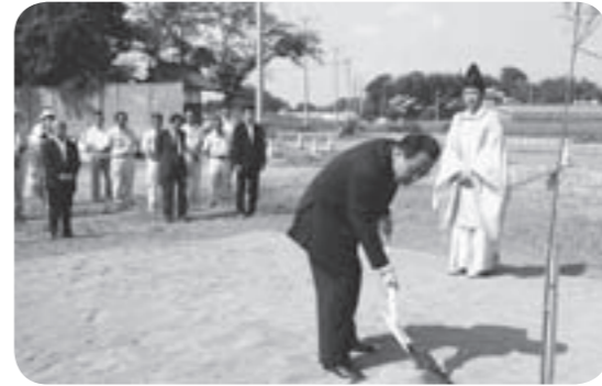
△緑入を行う片庭市長

からの幼児教育および保育、ならびに子育て支援のさらなる充実を図るため計画され、幼稚園7室180人、保育所5室100人を予定し、上小目地区に平成23年10月の開園を目指しています。