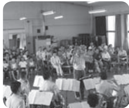
演奏に聞き入る皆さん

高齢者対象のよつわ大学のカリキュラムの一環として、茨城県警察音楽隊のコンサートが、7月21日、市伊奈公民館で開催されました。 当日は、よつわ大学受講生のほか、多くの市民が参加され、歌謡曲から洋楽まで幅広いジャンルにわたる、迫力あるコンサートを楽しみました。