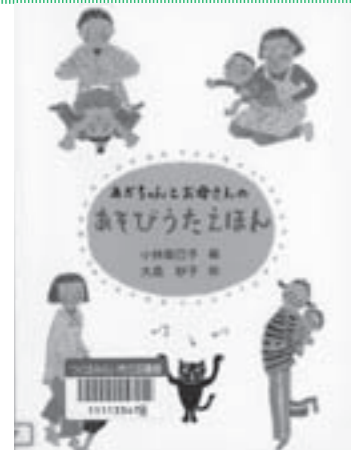
『あかちゃんとお母さんのあそびうたえほん』 こばやし 衛己子/編 おおしま たまこ/絵 大島 妙子/絵 のら書店

あと少して、夏休みも終わりです。どんな夏休みを送ったのでしょうか。思い出に残る「なつのいちにち」があったでしょうか。夏休みをふり返って、親子で話し合ってみるのによい絵本。