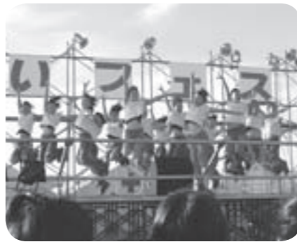
▷迫力あるダンスを披露した子どもたち

市商工会青年部主催による「みらいフェスタ2010」が8月7日、みらい平駅東方特設会場で行われました。当日は、真夏日となりましたが、そんな暑さも吹き飛ばさんばかりのダンスやショーがステージで披露されました。また、かき氷などの出店が立ち並び、夏休み中の子どもたちをはじめとした多くの来場者を楽しませていました。夜には、国指定重要無形民俗文化財に指定されている、市伝統芸能の「綱火」が夏の夜空をライトアップしました。