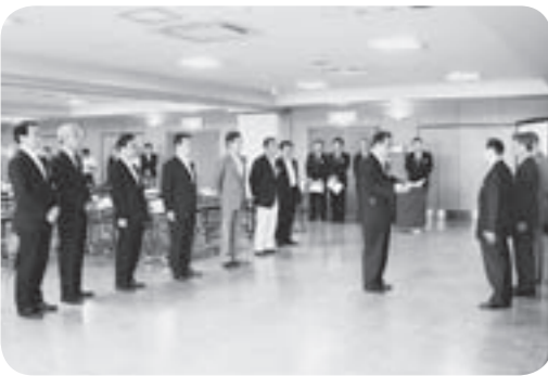
首都圏新都市鉄道(株)社長に要望を行う8市区長ら

TXは、今年で開業5周年を迎えますが、利用客数は当初計画を大きく上回る実績を上げています。TXが東京駅で各路線と結ばれた場合、首都圏における鉄道ネットワークをより強固なものにすることができると期待されています。