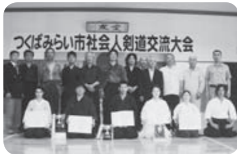
入賞された皆さん