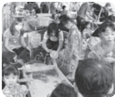
金魚すくいを楽しむ子どもたち

露天が軒を並べたほか、市高齢者センターには、青年会と子供会が金魚すくいなどの夜店を出し、浴衣姿の子どもたちを大いに楽しませていました。また、ハッピー姿の子どもたちは、山車やみこしに参加し、夏の思い出をつくっていました。