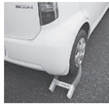
△自動車のタイヤロックを使用した差し押さえ例▽

滞納処分とは、納税義務者の所有する財産について、金融機関への預貯金調査や勤務先への