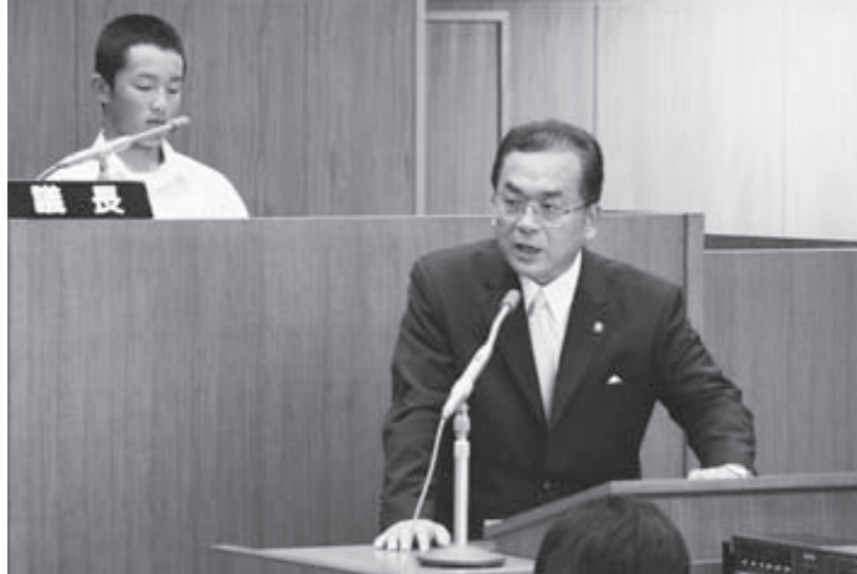
市長片庭の緊張感の中答弁する市議会

続いて、市道については、この道路は茨城ゴルフ場のコーラス沿いに位置しており、用地の買収が困難な現況になっております。現在は、大型車両の通行に規制をかけ、車両のすれ違いおよび、自転車・歩行者の危険回避に努めている状態に留まっ