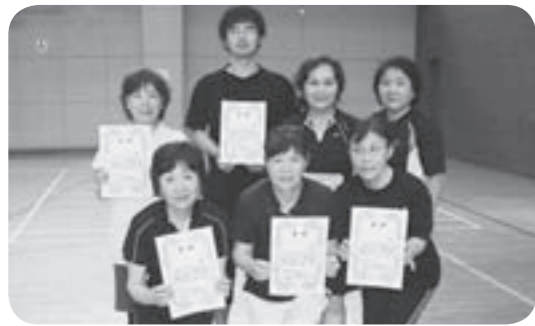
入賞された皆さん