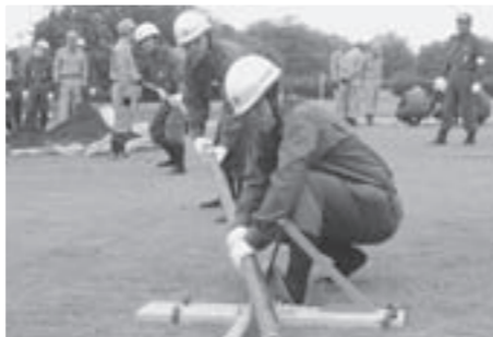
竹とげを行う消防団員たち

第51回を迎える、鬼怒・小貝水防連合体水防訓練が7月4日、小貝川沿いの小貝川スポーツ公園で行われました。訓練は「大型の台風が接近し、小貝川増水、堤防の決壊のおそれがある」との想定で行われ、本市のほか、つくば市、常総市、下妻市、八千代町の消防関係者約300人が参加しました。