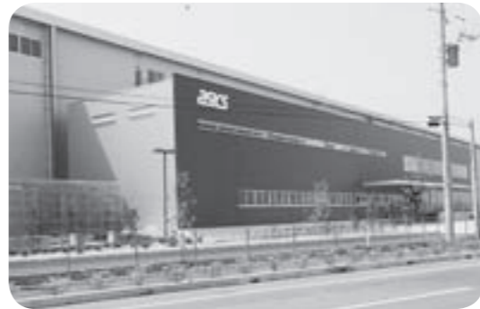
▷シューズボックスをイメージした外観のつくば配送センター

スポーツ用品メーカーの(株)アシックスの東日本の拠点となるつくば配送センターがみらい平に完成し、7月23日、竣工式が行われました。これから皆さんが身につけるアシックス製品の多くは、つくばみらい市から配送されます。今回、(株)アシックスがみらい平に物流拠点を設立したように、市では、茨城県と協力のもと企業誘致に力を注いでいきます。