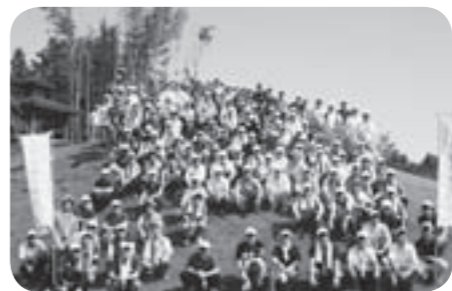
清掃活動にあたった(株)クボタ筑波工場の皆さん

皆さんのご協力により、年3回の園内除草を実施し、子どもたちが安心して遊べる公園を目指しています。