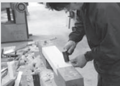
△補修している様子