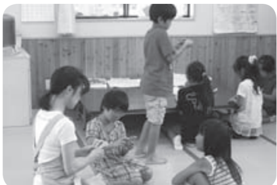
豊小児童クラブの様子