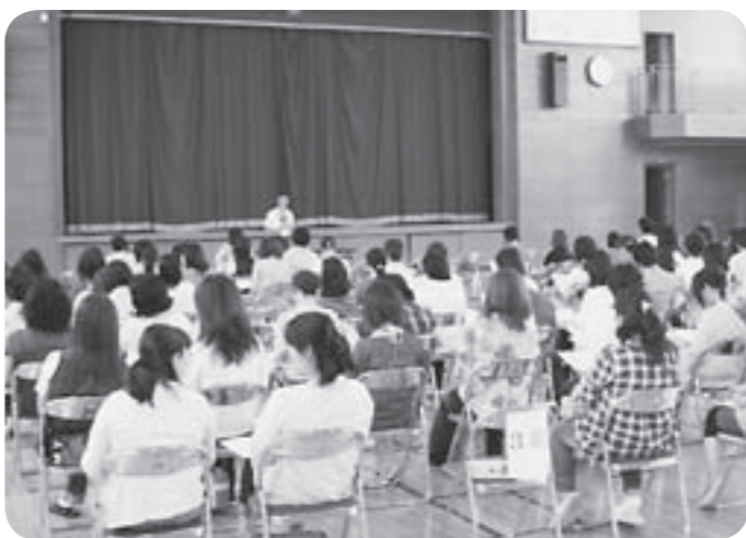
伊奈東中学校での説明会の様子

今回は、保護者の皆さんに説明した内容を市民の皆さんにも知っていただきたいと思えます。市では今後、必要に応じて地