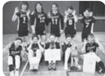
優勝したZEROの皆さん