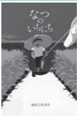
『なつのいちにち』 はたこうじろう/作 偕成社