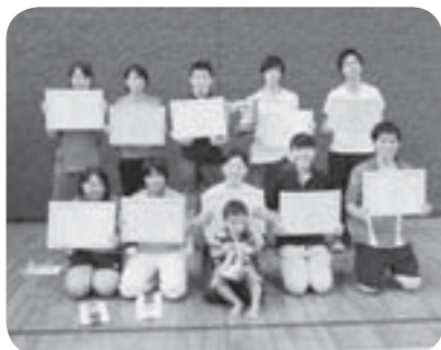
入賞された皆さん