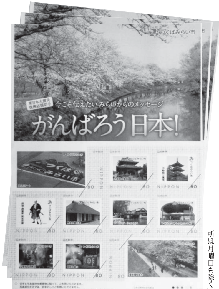
東日本大震災復興応援切手デザイン案

東日本大震災の被災地を支援するため、市では「東日本大震災復興応援切手」を販売します。市は、販売金額の一部、1シートにつき300円を義援金とし、被災地に送り、支援を行います。