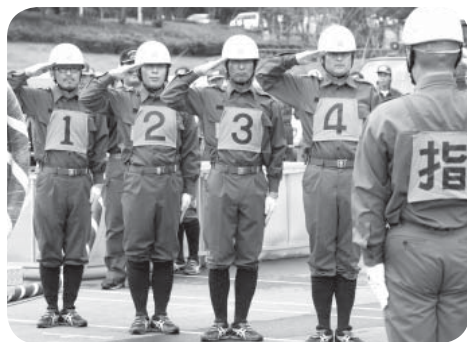
第3分団の選手の皆さん