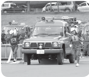
第一線放水始め! (第4分団)

第62回茨城県消防ポンプ操法競技大会県南北部地区大会が10月23日、つくば市北部工業団地内緑地で開催されました。