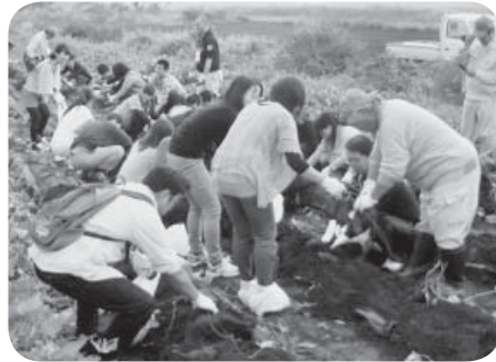
さつまいも掘りで距離を縮めて!!

段出会えない方々といろいろな話ができ、よかった」などの声があり、皆さん有意義に過ごされたようです。