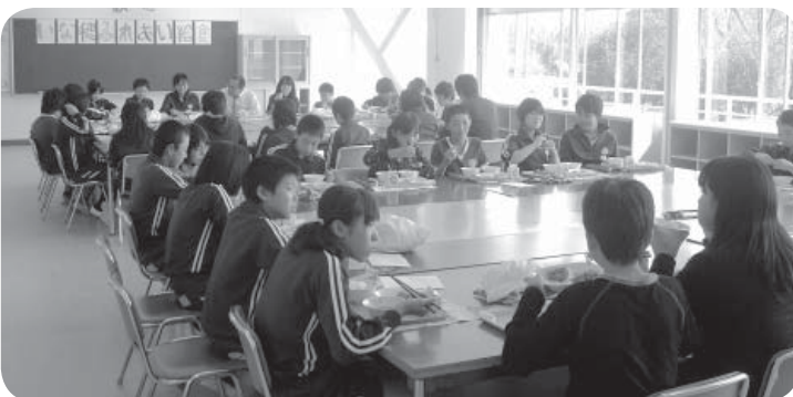
片庭市長と新米を味わう小張小の児童たち