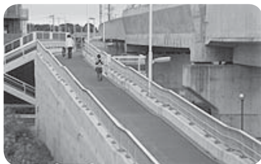
歩道橋のイメージ写真

しいようにスロープの勾配を緩くし、手すりや照明灯などのデザイン性を高め、シンボルとなる空間の創出を図ります。