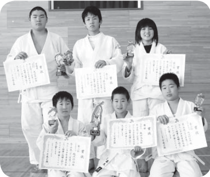
入賞された皆さん

お昼には、食生活改善推進協議会の皆さんが手作りしたけんちん汁が振る舞われ、参加者は冷え切った体を温めていました。