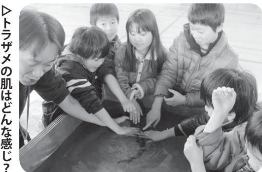
▶トラザメの肌はどんな感じ?