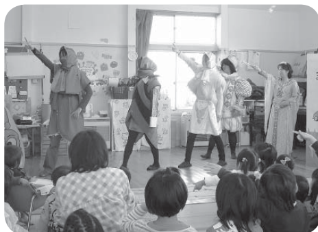
寸劇を行う母の会の皆さん