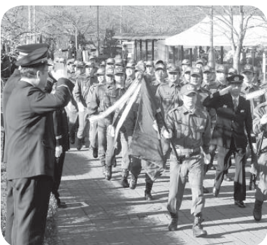
分列行進を行う消防団員の皆さん

地域防災の要となる市消防関係者による「消防出初式」が1月8日、きらくやまふれあいの丘世代ふれあいの館で行われました。