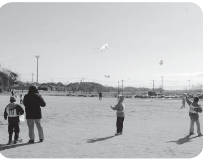
もっと高く揚がれ!

お昼には、食生活改善推進協議会の皆さんが手作りしたけんちん汁が振る舞われ、参加者は冷え切った体を温めていました。