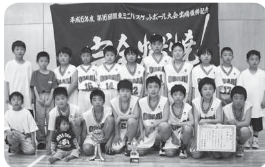
優勝した小張ミニバスチームの皆さん