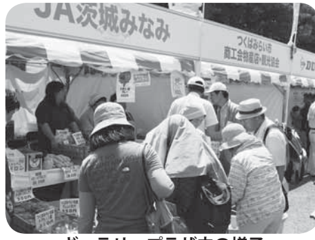
ギャラリープラザ内の様子

「ギャラリープラザ」では、市観光協会による観光PR、市商工会、JA茨城みなみや地元