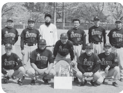
優勝したクレージーズの皆さん