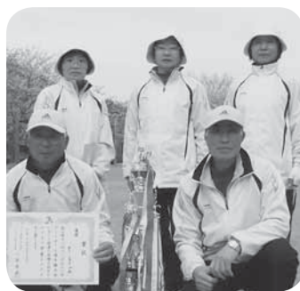
優勝したグリーンズチームの皆さん