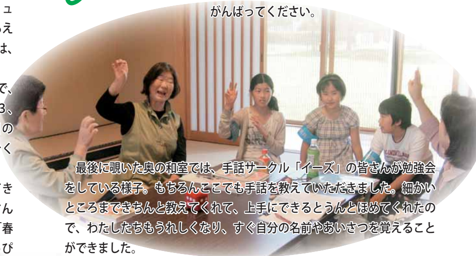
最後に覗いた奥の和室では、手話サークル「イーズ」の皆さんが勉強会をしている様子。もちろんここでも手話を教えていただきました。細かいところまできちんと教えてくれて、上手にできるとうんとほめてくれたので、わたしたちもうれしくなり、すぐ自分の名前やあいさつを覚えることができました。