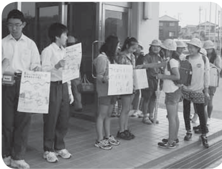
▷小絹小学校での募金活動の様子

6月2日にきらくやまふれあいの丘で開催された、社協まつり会場で、各学校の児童会、生徒