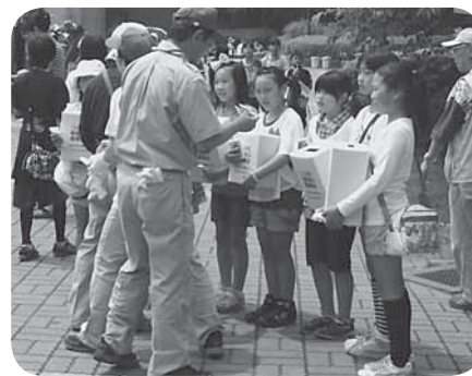
社協まつり会場内での募金活動の様子

6月2日にきらくやまふれあいの丘で開催された、社協まつり会場で、各学校の児童会、生徒