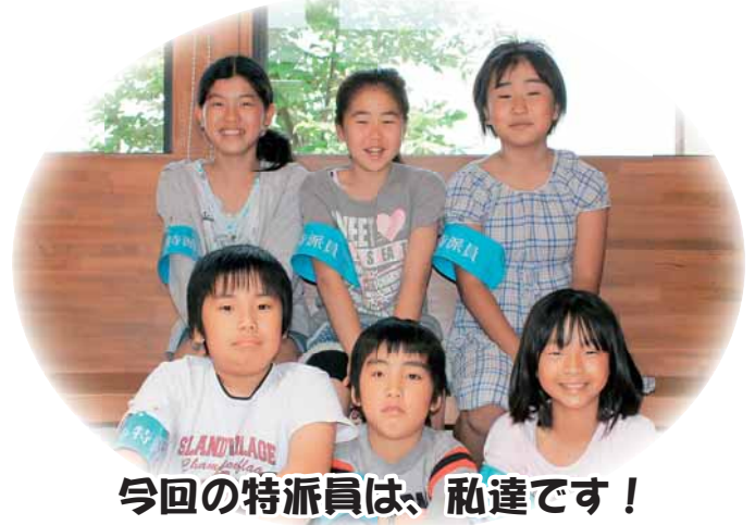
今回の特派員は、私達です！