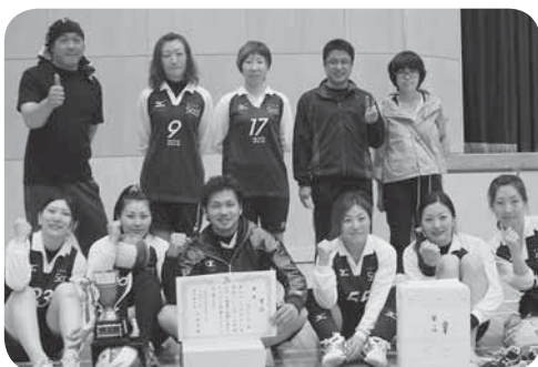
優勝したSucceedの皆さん