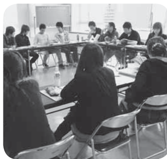
実行委員会の様子(昨年度)

平成25年1月に開催される成人式に向け、実行委員会のメンバーを新成人の皆さんから募集します。