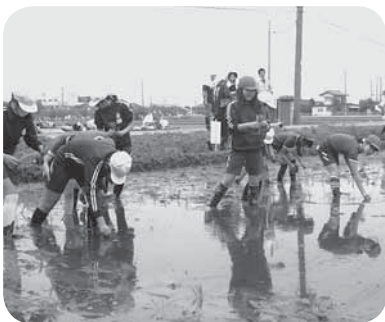
うまく植えられてるかな？