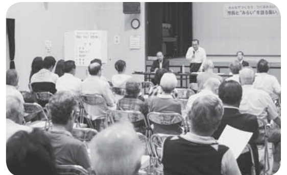
つくばみらい市の将来像を述べる片庭市長