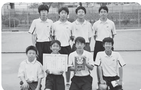
▷第3位になった伊奈中学校男子ソフトテニス部の皆さん