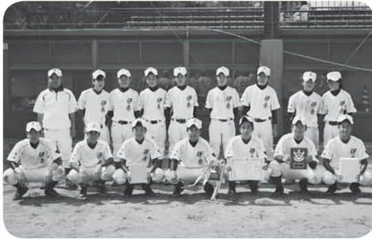
▷準優勝した伊奈中学校野球部の皆さん