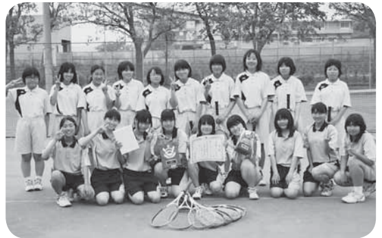
▷準優勝した谷和原中学校女子ソフトテニス部の皆さん