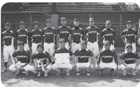
優勝したアプティパの皆さん