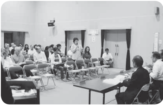
市長に提言を行う参加者

男性 このつくばみらい市で育った子どもたちが、自信を持って働ける場所をつくっていただきたいです。今、全国でも同じ問題を抱えているところは多いと思いますが、地元で育った子どもたちが、大学入学や就職をする、ほかの地域に行つてしまひ、育った地域に定着してくれません。結果的に高齢者だけが残つてしまう。そうならないような仕組みを、20年、30年の計画で作つていただきたい。今、このつくばみらい市には、全国から集まった知恵者がたくさんいらっしゃいます。また、いろいろな経験をされています。そのような人たちの知恵を借りながら、新たな仕組みをつくるプロジェクトを、つくばみらい市計画の中に取り入れていただきたいと思います。