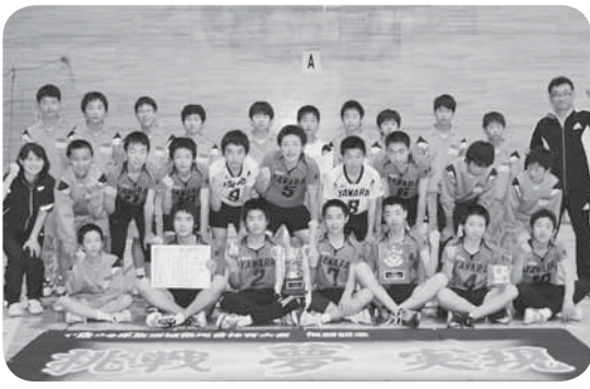
▷優勝した谷和原中学校男子バレーボール部の皆さん