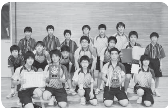
▷準優勝した伊奈東中学校男子卓球部の皆さん