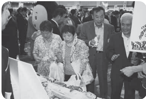
つくばみらい市産農産物をセールス

懇親会には、各界で活躍する本県関係者約500人が参加しました。会場内には、県内の市町村が出展ブースを設け、それぞれにPRを繰り広げました。