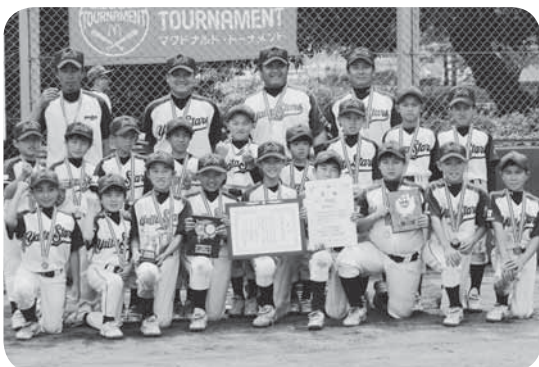
準優勝した谷井田スターズの皆さん

谷井田スターズは、7月28日から千葉県で開催される、関東ブロックスポーツ少年団競技別交流会に出場します。関東大会での活躍を期待しています。