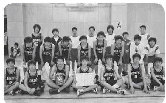
▷第3位になった小絹中学校男子バスケットボール部の皆さん