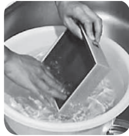
汚れを落としてから

② 汚れているものは出さない 物や商品を包んでいたもので、異物が混ざっているとリサイクルできません。汚れを落とす