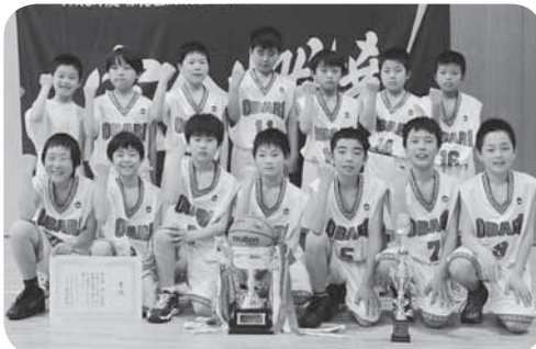
関東大会に出場する小張ミニバスの皆さん