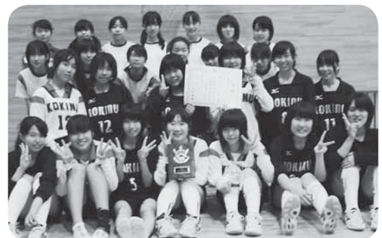
▷第3位になった小絹中学校女子バレーボール部の皆さん