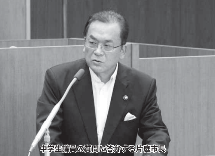
中学生議員の質問に答弁する片庭市長

トをかぶせていたとしても、100%放射線物質が漏れないという保障はできないでしょう。その汚染土の近くへ行き、雑草を捨てに行くことは気持ちの良いものではありません。