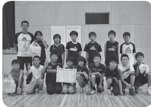
中学年の部優勝のワイルドスターの皆さん