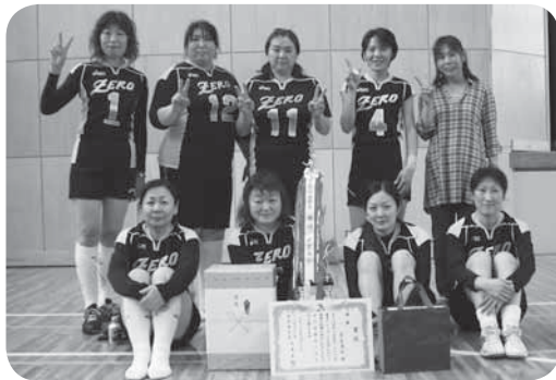
優勝したZEROの皆さん