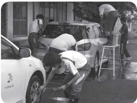
公用車を手洗い洗車する生徒の皆さん

における卒業後の「自立と社会参加」を目指した作業学習の一環として行われました。生徒の皆さんは、事前に学校で数回の練習を行ってから臨んでいただき、計4台の公用車がとてきれいにになりました。ありがとうございました。