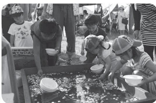
スーパーボールすくいに夢中になる子どもたち

また、会場内では、保護司、人権擁護委員・更生保護女性会の皆さんと、社会福祉協議会から中学生会・高校生会の皆さんが協力して、「社会を明るくする運動」～犯罪や非行を防止し、立ち直りを支える地域のチカラ～として、啓発活動を行いました。