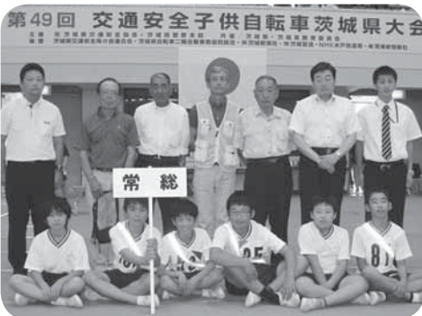
谷原小学校の選手たち（前列）と交通安全協会谷原分会（後列）の皆さん

選手たちは、毎日放課後に交通安全協会谷原分会の方々の指導を受けながら練習を重ね、自転車を安全に乗る知識と技能を身につけました。