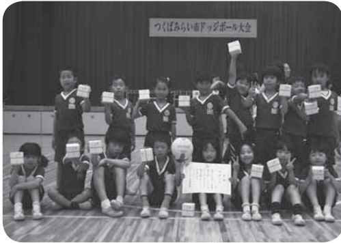
▷低学年の部優勝の小張最強スターズの皆さん