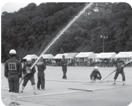
昨年の操法大会の様子

※今回の伝達試験は、全国一斉に実施されますので、つくばみらい市以外の市町村においても実施されます。