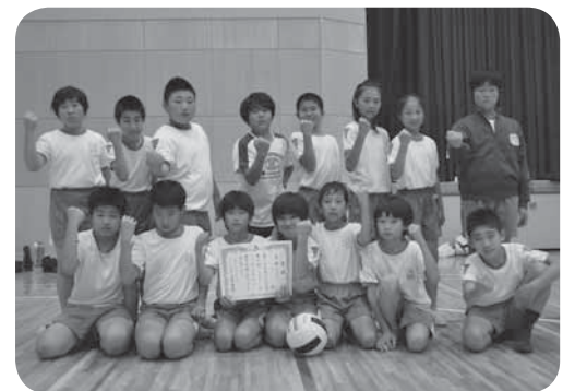
高学年の部優勝のV.D.B谷井田6年の皆さん