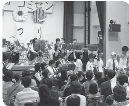
谷和原中学校吹奏楽部の発表の様子

企画から運営までを地域の文化団体の方々が行った「第5回小絹コミセンまつり」が7月8日、小絹コミュニティセンター