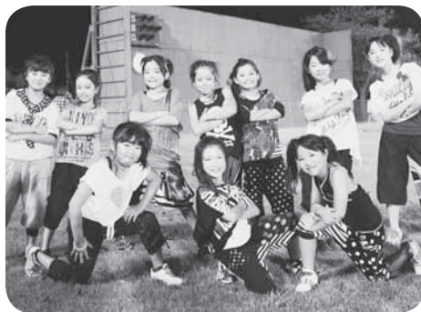
ダンスを披露した皆さん