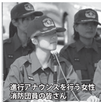
進行アナウンスを行う女性 消防団員の皆さん