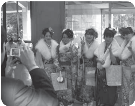
今年行われた、成人式会場内の様子

様より、安心して暮らせるまちづくりに役立ててほしいと、5万円が市に寄附されました。