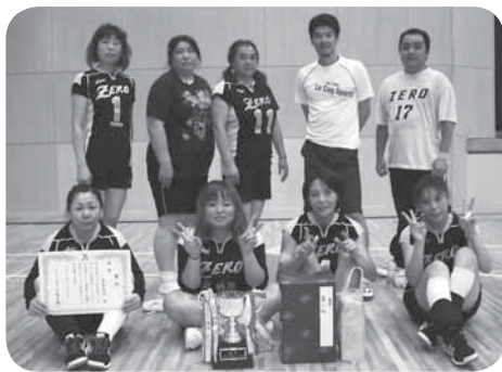
優勝したZEROの皆さん