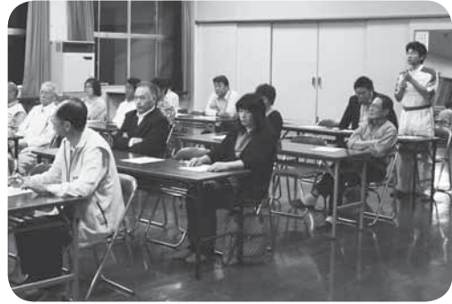
市長に提言・提案を行う参加者

を作ってもらいたい。行政だけでなく、地域の人が自分たちの地域を支えていけるシステムを作ってもらいたい。