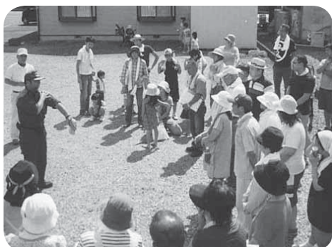
訓練に参加する松並住宅自治会の皆さん

当日は、午前10時に大地震が発生したとの想定で、自治区内の一時避難場所に避難を開始。班ごとに安否確認が行われました。今回の訓練をおし、地域での自助、共助の取り組みが重要であることが再確認されました。