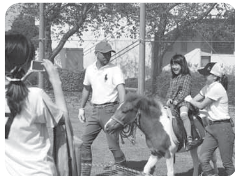
ポニーと一緒に、はいちーず♪