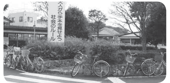
△駅前ロータリーに駐輪する自転車