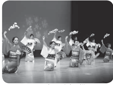
ステージでの発表の様子

文化の日の11月3日、4日の2日間にわたり、きらくやまふれあいの丘および谷和原公民館