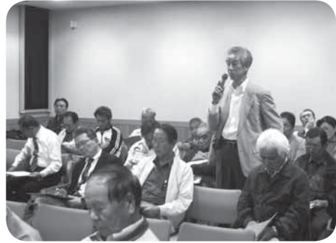
市長に提言・提案を行う参加者