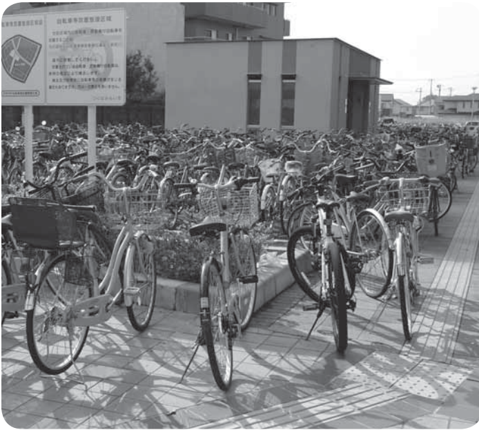
△駐輪スペース以外の歩道部分に駐輪する自転車