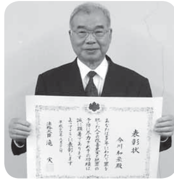
▷法務大臣表彰を受けた今川氏