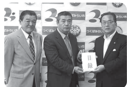
片庭市長に目録を手渡す小沼理事長と明問学園地区理事