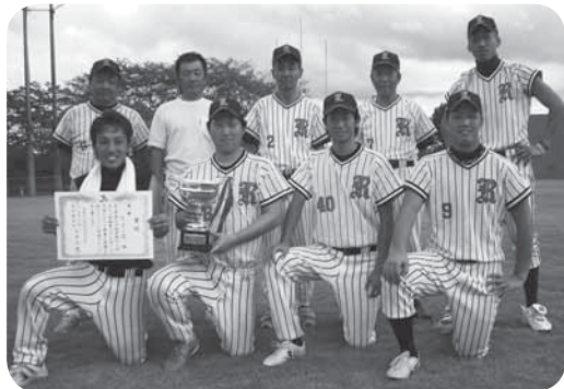
優勝したリリーズの皆さん