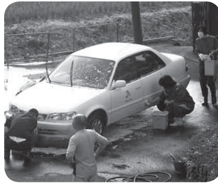
一生懸命作業をする生徒の皆さん

日、市役所公用車の洗車作業を行っていただきました。これは、同校における卒業後の「自立と社会参加」を目指した作業学習の一環として行われました。生徒の皆さんには、7月2日