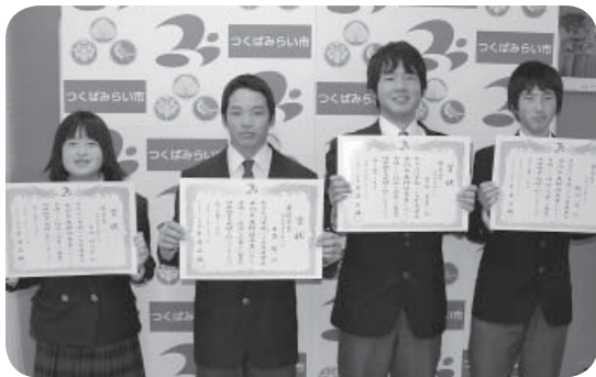
入選された皆さん

市では、性別にかかわらず、喜びも責任も分かち合う男女共同参画社会の実現をめざしています。家庭や職場、学校、地域の中で「男女共同参画社会」について感じたことや、日常生活の中で、親しみやすく取り組む