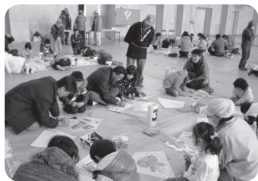
思い思いのたこを作る参加者