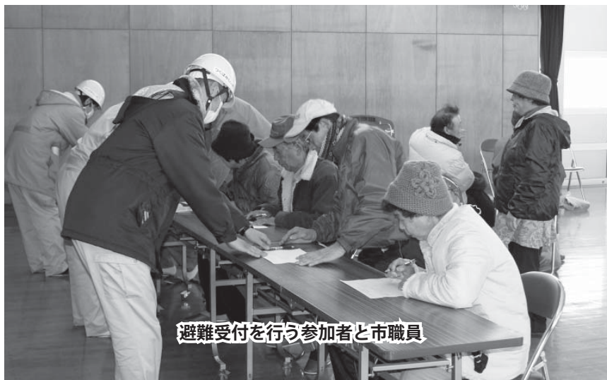
避難受付を行う参加者と市職員

伊奈ヒルズ自治会／青古新田行政区／山谷集落／谷井田南6区自治会／富美会（宮戸新田・川崎田目木地区有志）／さくら会／スポーツクラブみらい／朗読グループかたくり／株式会社スマイルケア／有限会社ホープ花みずきケアサービス／有限会社ホープデイサービス／有限会社ホープあかねホーム／特別養護老人ホームぬくもり荘／グループホームぬくもり／特別養護老人ホームいなりの里／社会福祉法人青洲会どんぐり村／特別養護老人ホーム雅荘／市社会福祉協議会／地域活動支援センターひまわり・さくら園／株式会社ガイアアート・K技術研究所／株式会社山田組／三建設備工業株式会社技術研究所／株式会社アンフィニ／株式会社二葉／株式会社十和観光／株式会社アルワーク／株式会社十和自工／トロー流通株式会社／十和運送株式会社／株式会社十和パレットサービス／浜野商事株式会社／伊奈工業株式会社／オービー建設株式会社／成建工業株式会社／関建設株式会社／成島建設株式会社／株式会社赤塚土木興業／株式会社新みらい／原信田建設株式会社／いなほ工業