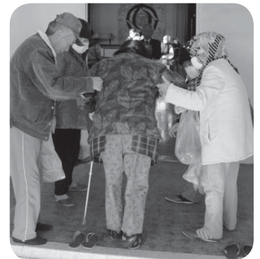
手を取り合い避難する参加者

市では、県内初となる「効果的な防災訓練と防災啓発」提唱会議（略称・シェイクアウト提唱会議）の認定を受けた「つくばみらい市防災訓練」を1月23日に実施しました。訓練には、公立保育所、幼稚園、小中学校、市内企業、団体の皆さんら約9200人が参加しました。今回の訓練は、「自分の命は自分で守る」＝「自助」、「みんなで助け合う」＝「共助」の訓練および啓発を主体に置き実施しました。 訓練は「1月23日午前10時、茨城県南部を震源とする大規模な地震の発生」を想定。防災行政無線で安全確保を呼びかける放送を合図に、参加者は、その場で、1・2・3「まず低く、頭を守り、動かない」の安全行動を行い、自分の身を守る行動