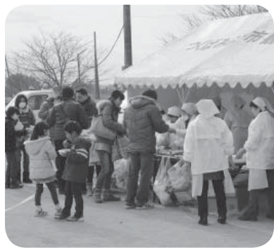
けんちん汁コーナーに並ぶ参加者