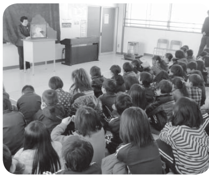
紙芝居に聞き入る児童たち

2年生を対象に開催されました。教室では、たくさんの魚の中学生でいじめられる白い魚とサメの子が登場する紙芝居が披露さ