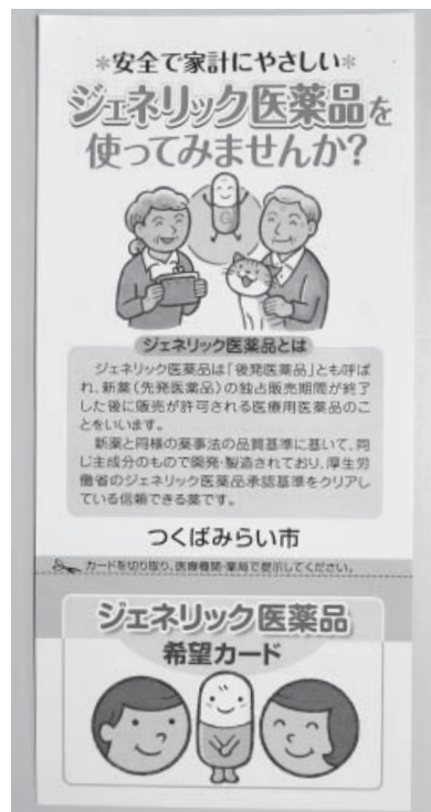
リーフレット表面

■ジェネリック医薬品とは 「後発医薬品」とも呼ばれ、当初開発された「先発医薬品」の独占販売期間が終了した後に販売される医薬品のことです。 ■効果・効能は 先発医薬品と同じ主成分で製造されており、有効性や安全性も同等であり、厚生労働省のジェネリック医薬品承認基準をクリアしている信頼できる薬です。