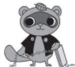
消費生活センターイメージキャラクター『まみりん』

例えば、壁紙のアプリなのに位置情報や電話帳など、必要のない情報にアクセス許可を求めてくる場合は、許可をせずインストールを中止しましょう。