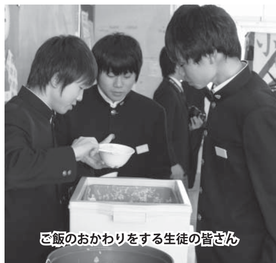
ご飯のおかわりをする生徒の皆さん

市では、今後もさまざまなイベントや文化、スポーツの交流促進を図り、伊奈町との友好関係をより良いものとしていきます。