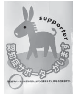
認知症サポーターステッカー

講座を実施します。受講後は、認知症を理解し、認知症の方や家族にとって優しい事業所の証である認知症サポーターステッカーをお渡しします。受講を希望される事業所は、介護福祉課までお問い合わせください。