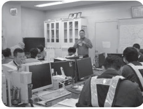
熱心に講義を受講される隊員の皆さん

市内事業所を対象とした『認知症サポーター養成講座』を、株式会社ネクスコ・パトロール 関東谷和原事業所で開催しました。