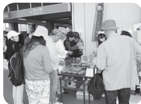
▷にぎわう特設ブースの様子

あつて多くの方の目にとまり、ゴルフの観戦後には、お土産として買っていく姿も多く見られました。