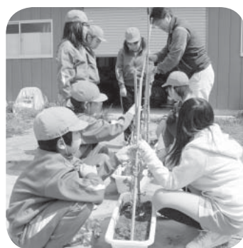
▷鉢植えをする6年生の児童たち

4月10日には、谷井田小の6年生の児童が鉢植えをし、「花やサヤが紫色をしていることにびっくりした。大きく育てて、