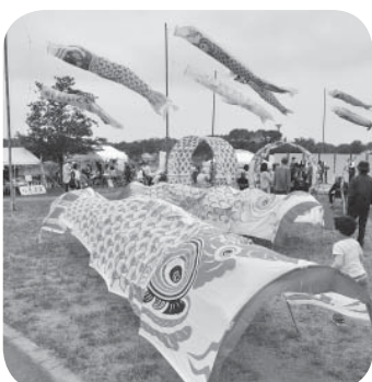
▷悠々と泳ぐ鯉のぼり

つくばみらい市と取手市の市境、小貝川・岡堰で4月29日から5月5日まで「鯉のぼりプロジェクト in 岡堰」が開催されました。風を受け力強く空を泳ぐ迫力満点の鯉のぼりが、小貝川の水面を彩りました。開催期間中は、林蔵太鼓やフラダンスなどさまざまな催し物が企画され、会場を盛り上げていました。