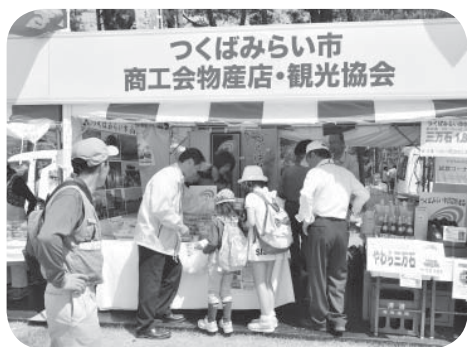
▷ギャラリープラザの様子

会場内には、ギャラリーを対象にした「ギャラリープラザ」が開設され、観光PRや市特産品「みらいプレミアム」の販売