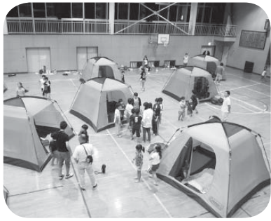
避難所訓練の様子