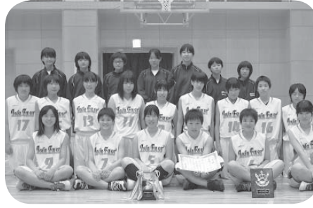
■女子バスケットボール 準優勝 伊奈東中学校