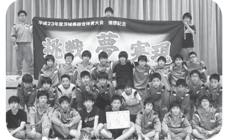
■男子バレーボール 3位 谷和原中学校