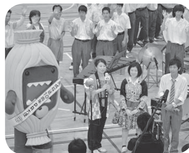
インタビューされる伊奈高の皆さん

6月4日、NHK県域放送「ニュースワイド茨城」の番組コーナー「みんなで！いばらナイト」の中で、つくばみらい市が特集されました。