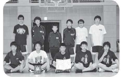
■男子バスケットボール 3位 伊奈東中学校

▷参加した選手の皆さん 【市混合バレーボール大会】 期日 5月18日 場所 総合運動公園体育館 優勝 ZERO 準優勝 ANGELS 第3位 シルキーズ 第3位 Succeeded