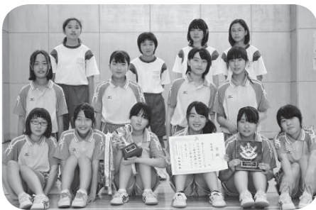
■女子卓球 準優勝 小絹中学校