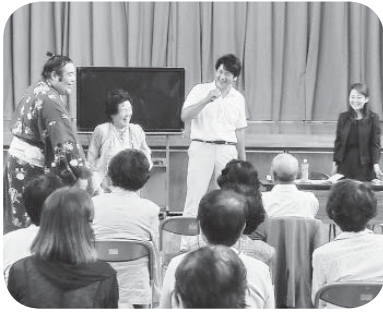
講演する立浪部屋の皆さん

よつわ大学は「見て・聞いて・学んで」を目的に、伊奈・谷和原公民館でそれぞれ年7回開催しています。6月4日に谷和