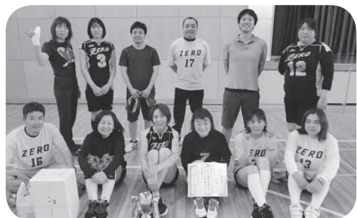
優勝したZEROの皆さん

【市春季野球大会】 期日 5月18日、25日、6月1日 場所 総合運動公園野球場ほか 優勝 カルピン 準優勝 アプティパ 第3位 コスモス 第3位 ヤイターズ