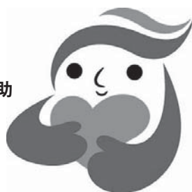
犯罪被害者等支援シンボルマーク「ギュっとちゃん」

(空くじなし) をご用意して、皆さまのご来場を会員一同お待ちしています。ご近所お誘い合わせの上、奮ってご参加ください。