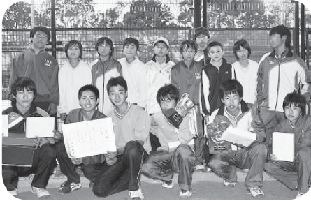
■男子ソフトテニス 準優勝 伊奈中学校

実施された競技は、「ソフトテニス」「野球」「バスケットボール」「バレーボール」「卓球」の5種目で、市内の中学生が活躍し、優秀な成績を収めました。