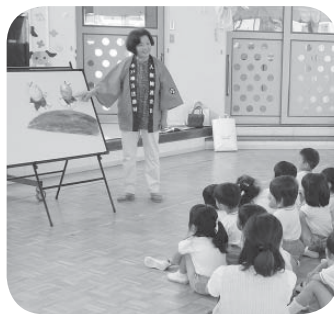
熱心に聞き入る園児たち

人権擁護委員は、市民の皆さんの相談パートナーです。本市の人権擁護委員が、女性・子ども・高齢者などをめぐる人権の問題や近隣とのトラブルなど身近で困っていることの問題解決の方法を相談される方と一緒に考えます。毎月1回「人権相談所」を開設しておりますのでお気軽にご相談ください。プライバシーは厳守されます。