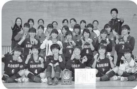
■女子バレーボール 準優勝 小絹中学校