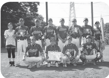
優勝したカルピンの皆さん

【市春季野球大会】 期日 5月18日、25日、6月1日 場所 総合運動公園野球場ほか 優勝 カルピン 準優勝 アプティパ 第3位 コスモス 第3位 ヤイターズ