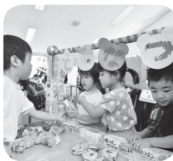
夏祭りを楽しむ園児たち

色を塗ったりしてつくった手作りの遊園地が、部屋いっぱい広がりました。この日は年長組、年中組の園児が年少組の園児と手をつなぎ、お化け屋敷に入ったり、お店屋さんでカラフルな紙のドーナツを食べたり、海賊船に乗ったりと楽しく遊びました。