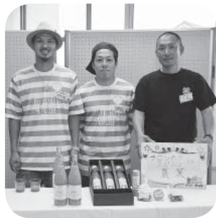
つくばみらい4Hクラブの皆さん

人権擁護委員は、市民の皆さんの相談パートナーです。本市の人権擁護委員が、女性・子ども・高齢者などをめぐる人権の問題や近隣とのトラブルなど身近で困っていることの問題解決の方法を相談される方と一緒に考えます。毎月1回「人権相談所」を開設しておりますのでお気軽にご相談ください。プライバシーは厳守されます。