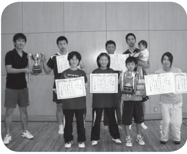
優勝ペアの皆さん

■市長杯ゲートボール大会 市長杯ゲートボール大会が10月12日、きらくやまゲートボール場で開催されました。8チームが参加した大会の結果は次のとおりです。