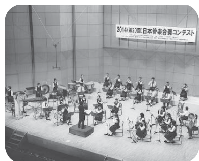
谷和原中学校吹奏楽部の皆さん

から多くを学ぶことができたので、今後の活動に活かしていきたい。また、家族をはじめ、私たちを日頃から支えてくれていた皆さんに感謝したい」と話してくれました。