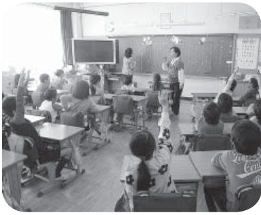
熱心に取り組む児童たち

人権擁護委員会による人権教室を、10月28日と11月18日の両日、福岡小学校、東小学校でそれぞれ