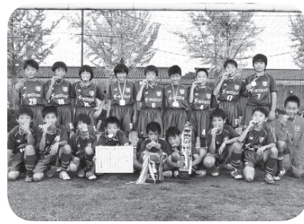
優勝した常総アイデンティの皆さん