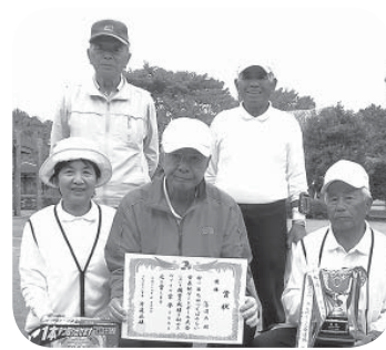
優勝した高波Aチームの皆さん