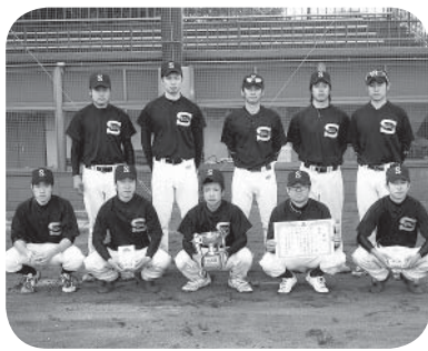
優勝したゴールド☆Sの皆さん