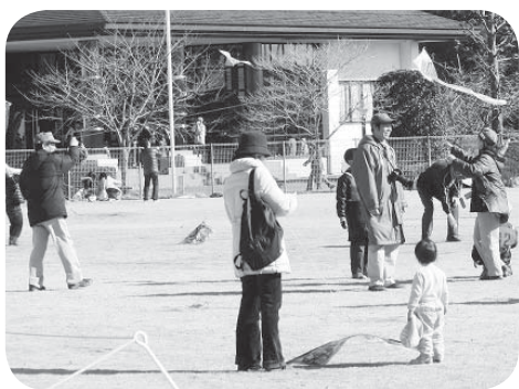
▷昨年の大会の様子