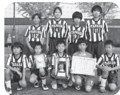
U-12 優勝の板橋FCの皆さん