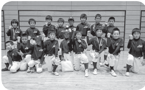
入賞したやわらメッツIIの皆さん