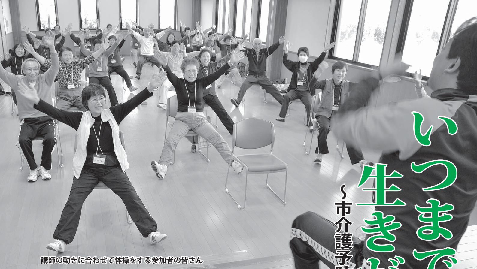
講師の動きに合わせて体操をする参加者の皆さん