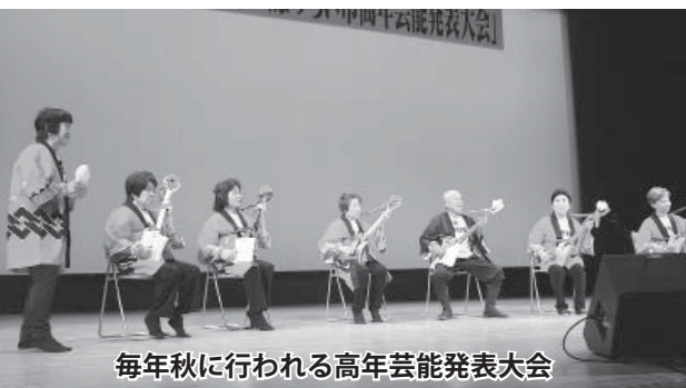
毎年秋に行われる高年芸能発表大会