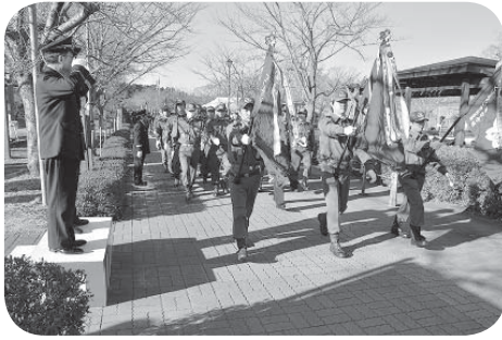
分列行進する団員たち

参加した消防関係者約300人は防火・防災の決意新たに、片庭市長、鈴木消防団長の前を