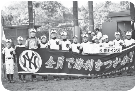
豊ナインズの皆さん