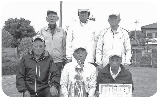
優勝した西の台クラブの皆さん