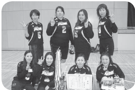
優勝したZEROの皆さん