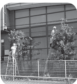
剪定を行う会員の皆さん

毎月行っていますので、興味のお ある方はお問い合わせください。 問 つくばみらい市シルバー人材 センター ☎25・2102