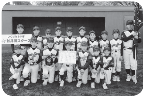
谷井田スターズの皆さん

優勝 牛久中根サンダース 準優勝 豊ナインズ 第3位 谷井田スターズ 新利根エンゼルス