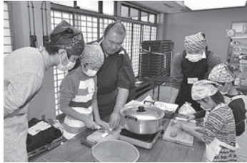
どすこい！クッキングの様子

家庭における父親の子育て参画促進や、ワークライフバランス（仕事と生活の調和）について考えるきっかけとなりました。立浪部屋の協力のもと、父と子で楽しく調理実習を行いました。家庭も仕事も大切なもの、いつでも協力し合うことは充実した生活への一歩です。