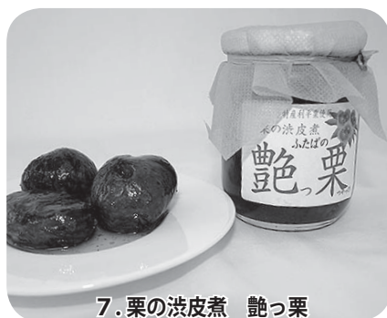
7. 栗の渋皮煮 艶っ栗