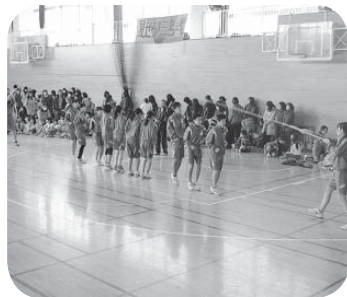
優勝した Peace の皆さん