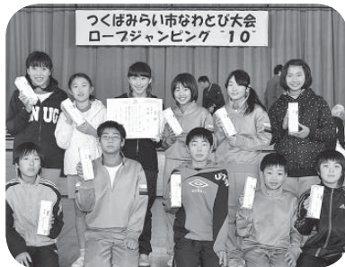
優勝した Team Kizuna の皆さん