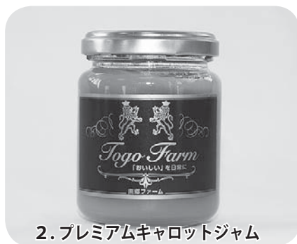
2. プレミアムキャロットジャム