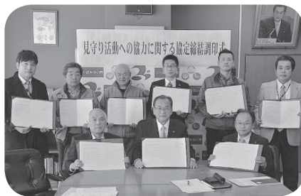
片庭市長（前列中央）と見守り協力協定を締結した事業所代表の皆さん

市では、安心安全なまちづくりに推進するため1月29日、市内に配達などを行っている乳飲