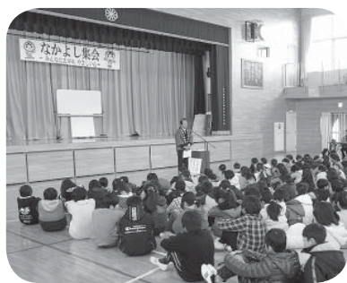
熱心に聞き入る児童たち