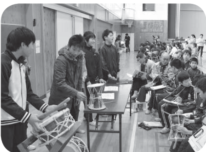
研究発表会の様子