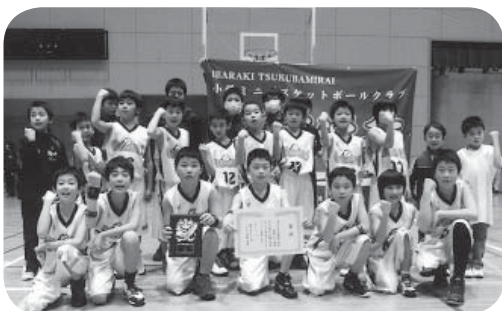
小張ミニバスケットボールクラブの皆さん

今大会は、1次リーグ、2次リーグを勝ち上がった8チームにより決勝リーグが行われ、その後の順位決定戦で、市スポーツ少年団「小張ミニバスケットボールクラブ」が準優勝の好成績を収めました。皆さんの今後の活躍を期待しています。