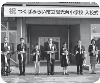
▶テープカットに臨む片庭市長