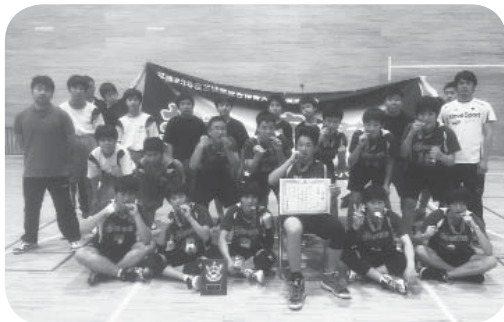
谷和原中学校の皆さん