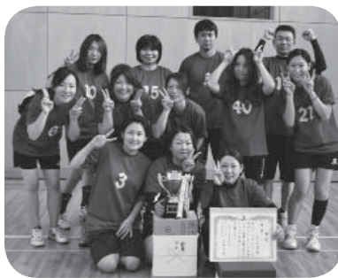
優勝したANGELSの皆さん