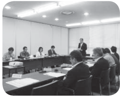
有識者会議の様子