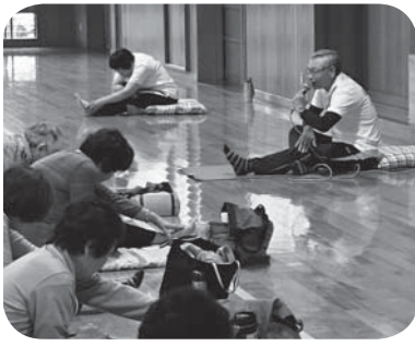
生き生きクラブで体操をする参加者