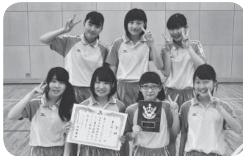
小絹中学校の皆さん