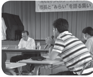
提言を行う参加者

『市長と“みらい”を語る集い』を谷井田コミュニティセンターで6月19日に、7月4日には伊奈公民館を会場に開催しました。両日合わせて、25人の市民の皆さんが参加してください、