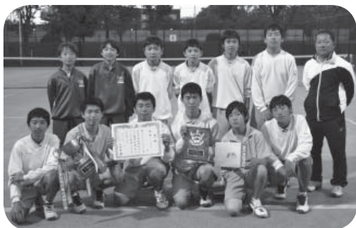
伊奈中学校の皆さん