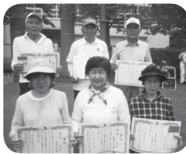
入賞した選手の皆さん