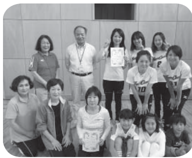
優勝したチームの皆さん