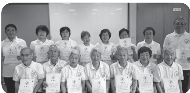
感謝状を授与されたシルバーリハビリ体操指導士の皆さん