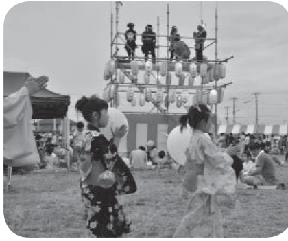
▶昨年の「みらいフェスタ」