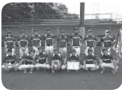
優勝したアプティバの皆さん

期 日 5月17日・24日・31日 場 所 総合運動公園野球場ほか 参加数 19チーム 【成績】 優勝 アプティバ 準優勝 ヤイターズ 第3位 コスモス 第3位 チャブス