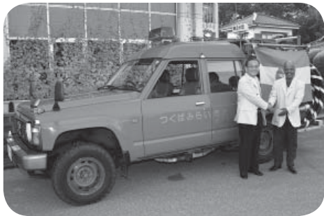
片庭市長(左)から目録を受け取るガライヤ氏(右)

最近、プラチナ世代と呼ばれる元気な高齢者が増えていて、体力も経験もあり、活用しない手はないと思う。例えば、市内を案内するボランティアなど、さまざまな活動で彼らの力を借りてはどうか。