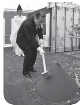
▷くわ入れを行う片庭市長

伊奈庁舎建て替え工事の起工式を7月27日、伊奈庁舎に隣接する建設予定地で行いました。現在の伊奈庁舎は、耐震診断