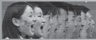
①みらいロボリンぞう