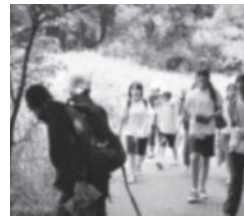
茨城自然博物館見学