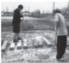
ボランティア活動