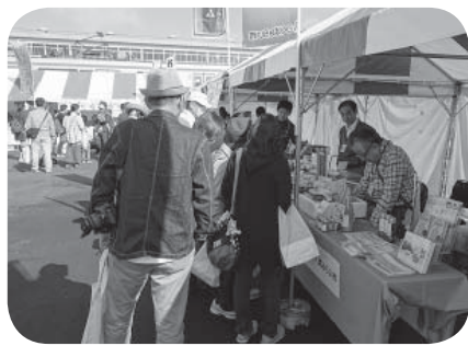
来場者にみらいプレミアムをPR

会場には当市の観光協会も出展し、認証特産品「みらいプレミアム」の試食・販売を行うなど、市の魅力をPRしました。