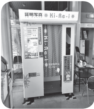
▷庁舎に設置された証明写真機

マイナンバー制度の開始に伴う個人番号カードの申請や、パスポートなどの交付申請を行う際に便利です。ぜひ、ご利用ください。 市役所開庁日(午前8時30分～午後5時15分)にご利用いただけます。