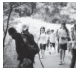
茨城自然博物館見学