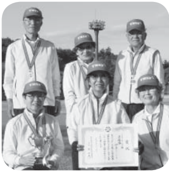
▷準優勝した伊奈グリーンズの皆さん

首都圏新都市鉄道(株)が主催の「つくばエクスプレスまつり2015」が11月3日、筒戸にある同社の総合基地で行われました。TX開業10周年記念となる今年、車両工場を初めて一