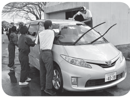
一生懸命に作業する生徒の皆さん