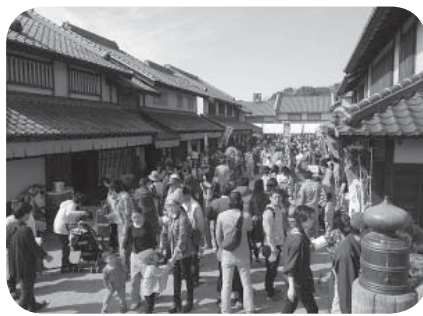
大勢の来場者でにぎわう会場内

この作業は合計4回に渡り継続して行われる予定で、今回は、伊奈庁舎の公用車4台を手洗いで洗車していただきました。ありがとうございました。