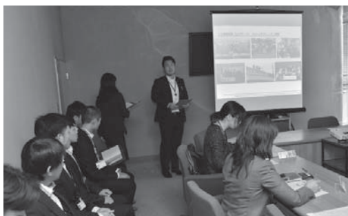
スクリーンを使って説明をする10周年プロジェクトチーム