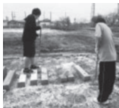
ボランティア活動