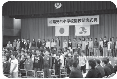
式典で校歌斉唱する児童の皆さん