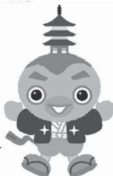
イメージキャラクター みらいんぞう