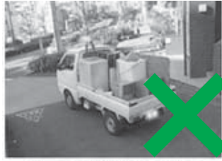
トラック型不用品回収