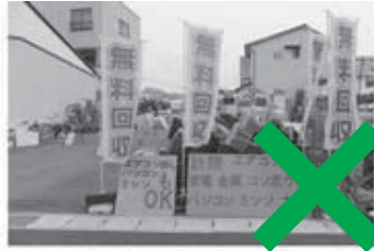
拠点型不用品回収