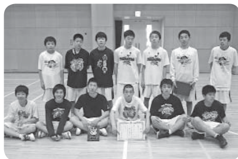
■男子バスケットボール 第3位 谷和原中学校