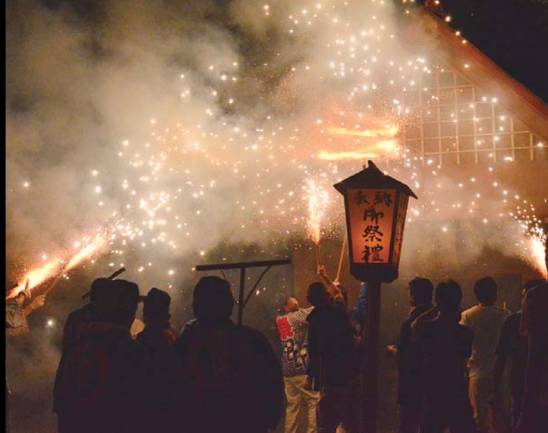
▲手製の火花から噴き出す火花で神社を清める 高岡流綱火「くりこみ」 ▼高岡流綱火「高岡丸の舟遊び」