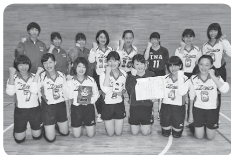
■女子バレーボール 第3位 伊奈中学校