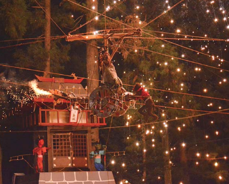
▲精巧に作られたからくり人形が芝居を演じる 小張松下流綱火「桃太郎鬼ヶ城の戦い」 ▼小張松下流綱火「二六三番叟」