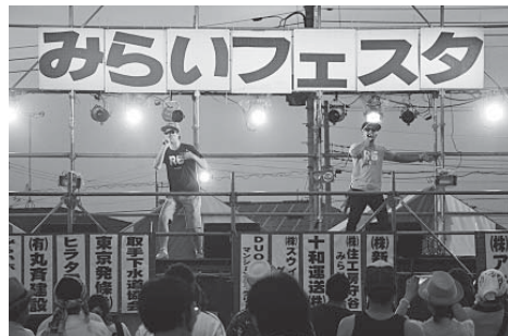
多くの来場者でにぎわった昨年のみらいフェスタ