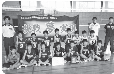
■男子バレーボール 第3位 谷和原中学校

実施された競技は「ソフトテニス」「野球」「バスケットボール」「バレーボール」「卓球」の5種目で、市内の中学生が活躍し優秀な成績を収めました。結果は次の通りです。