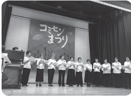
コミセンまつりの様子

できあがったばかりの新茶を試飲した生徒たちは「手作りは香りがいい」「おいしい」と笑顔を見せ、和菓子と一緒に味わっていました。