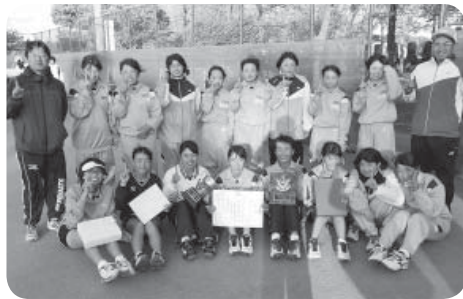
■女子ソフトテニス 優勝 谷和原中学校