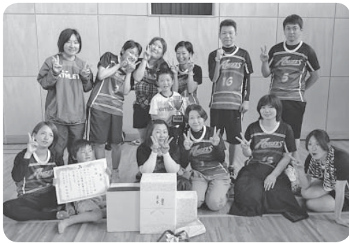
▷優勝したANGELSの皆さん