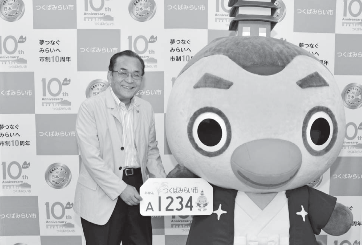
みらいりんぞうも一緒にご当地ナンバーをPR

市制施行10周年を記念して、市のイメージキャラクター「みらいりんぞう」をデザインに使用したオリジナルナンバープレートの交付を開始します。皆さんが愛用するオートバイに取り付けて、一緒につくばみらい市をPRしましょう。