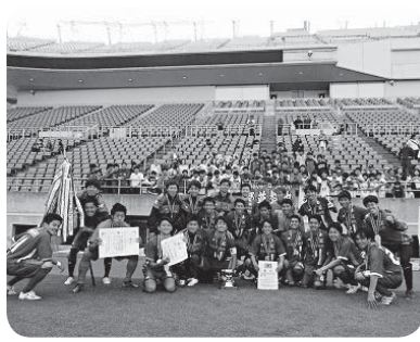
優勝したアイデンティみらいの皆さん

地域で応援されるプロチームを目指してつくばみらい市を拠点に活動しているサッカークラブ「アイデンティみらい」。そのトップチーム（18歳以上の選