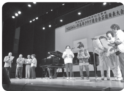
当日のステージ発表の様子

た。会場にはアームレスリングやターゲットバードゴルフ、バウンドテニス、グラウンドゴルフ、乗馬、ゲートボールなどさまざまなスポーツを体験できるブースが用意され、参加した皆さんは笑顔で汗を流しました。