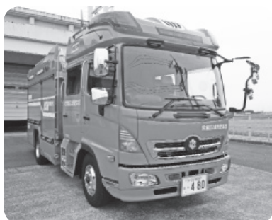
新しく配備された消防車