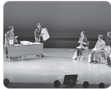
寸劇で注意を呼びかけました

パーマーケットで、来店者に悪質商法や二重電話詐欺の被害防止を訴えながらチラシとグッズを配りました。