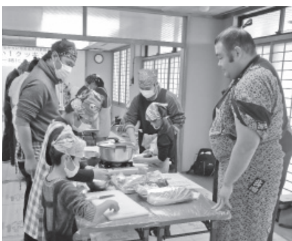
▷立浪部屋の力士の皆さん指導の下、料理をする参加者

人生の目標を立てる「立志」の時期を迎える中学生に、男女共同参画社会について深く理解してもらうため、市職員による出前講座を実施しています。