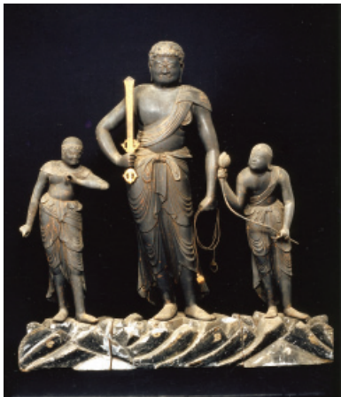
▶木造不動明王及両童子立像（国指定重要文化財・昭和25年指定）

手に三重塔がそびえ立ち、厳かな雰囲気包みこまれます。荘厳なたたずまいの本堂には、国指定重要文化財である「木造不動明王及両童子立像」が安置されています。 また、板橋不動尊には桜が植えられており、春になると満開の花で華やかに彩られた境内の様子を楽しむことができます。