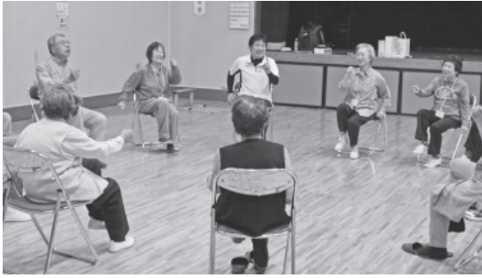
あなたの元気応援塾