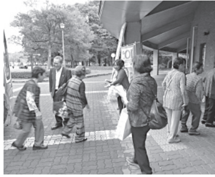
▷啓発キャンペーンの様子

当日は市男女共同参画推進委員4人が、来場者に「男女共同参画にご協力をお願いします」と声をかけながら、啓発品を配布しました。