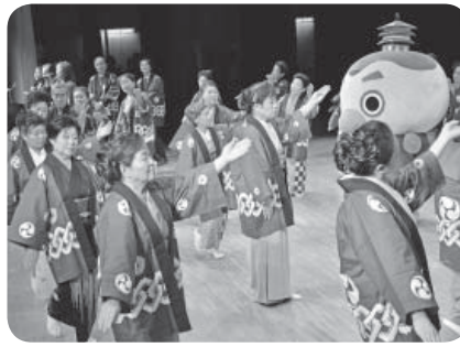
振り付けを披露する市文化協会舞踊部の皆さん

市制施行10周年を記念し制作を進めていた「つくばみらい市音頭」が完成し、10月29日、市文化祭でお披露目しました。