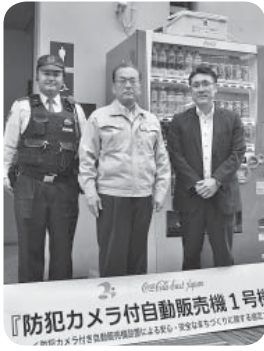
▷今回設置された1号機

コカ・コーライーストジャパン(株)と本市が締結した「防犯カメラ付き自動販売機設置による