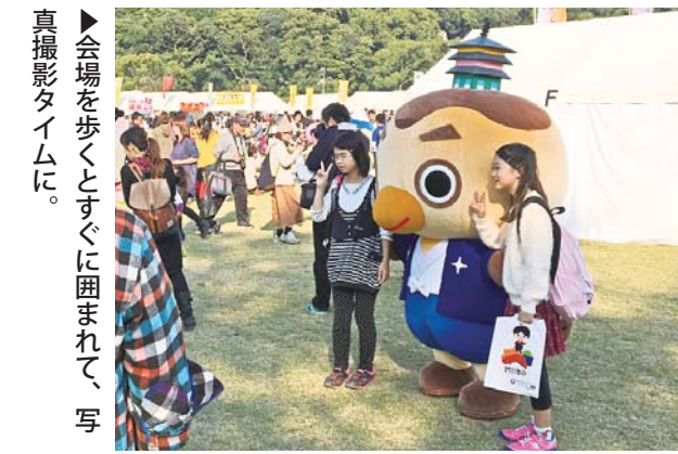
▶会場を歩くとすぐに囲まれて、写真撮影タイムに。