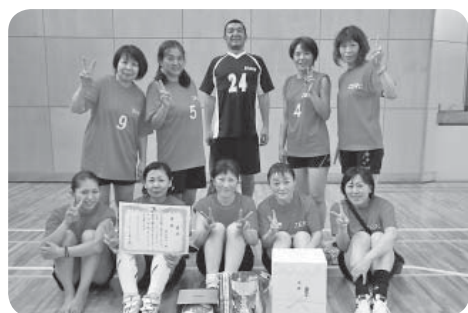
優勝したZEROの皆さん