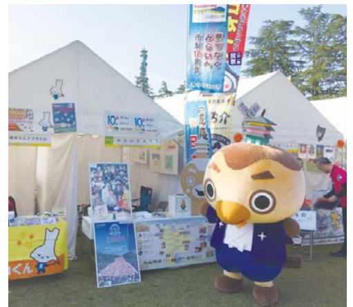
▶ブースを設置していざPR開始！ お隣はカミスココくんでした。