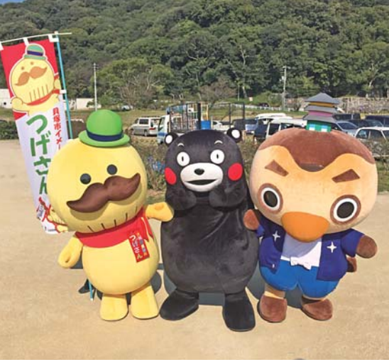
▲つげさん ® (大阪府貝塚市)、くまモン ® (熊本県)と一緒に記念撮影。