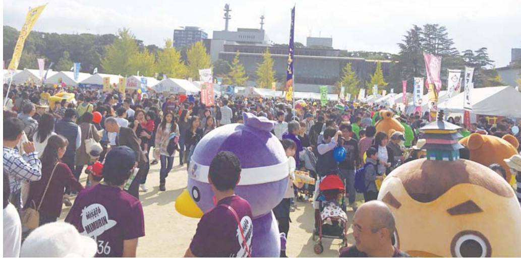
▼カミスココくん ® (神栖市)、はながたべニちゃん ® (山形県山形市)と一緒に。