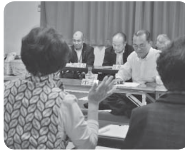
市長に提言をする参加者【十和地区】