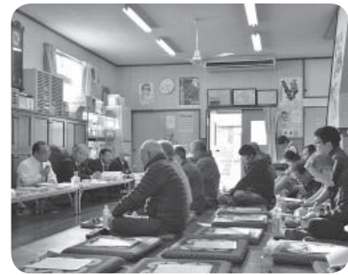
伊奈東地区での懇談会の様子

4月14日に発生した熊本地震災害で被害を受けた方々を支援するため、4月15日～9月30日まで伊奈・谷和原庁舎、きらくやま