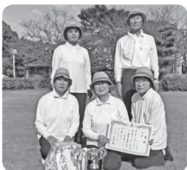
▷優勝したグリーンズの皆さん