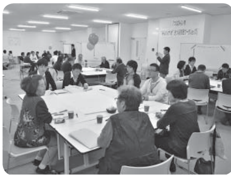
▷ワークショップの様子

市では、次期総合計画（計画年度平成30年度～31年度）の策定に向け、一般公募で募集した