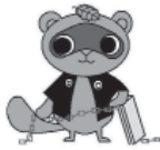
消費生活センターイメージキャラクター『まみりん』

JATA（日本旅行業協会）が観光庁届出のガイドラインに沿って作られていると認められたもので安心です。 通信契約の支払いにはクレジットカードを使用しますが、カード番号を伝え、旅行会社が承諾すれば契約が成立するのが特徴です。思わぬキャンセル料が発生する場合がありますので、十分注意してください。