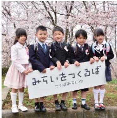
小張小学校新1年生のお友だち