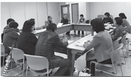
情報交換会の様子

市民主体の地域づくりを推進するため、市民が自主的に取り組む活動を支援する「平成29年度市ふれあいコミュニティ補助事業」を募集します。