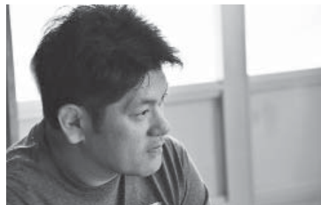
立浪部屋 立浪 耐治 師匠

地元根差した相撲部屋・立浪部屋として、今後の抱負を尋ねた。「地元の人応援が一番ありがたい。いずれは自分の番付（小結）を超える力士を育てたい。かつての立浪部屋のように、強い力士が大勢いる部屋に」と今後の飛躍を誓った。