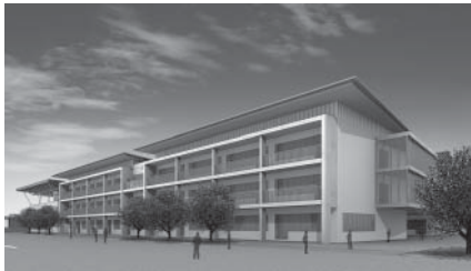
富士見ヶ丘小学校の完成イメージ