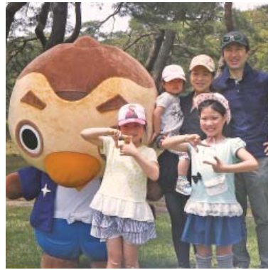
親子体操に参加してくれた皆さん