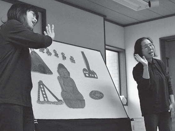
紙ふうせんの皆さんによるパネルシアター