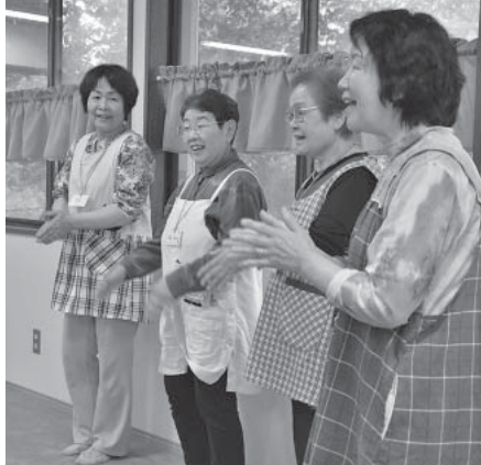
いつも元気なソレイユの皆さん