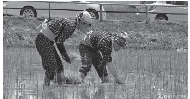
▲昔ながらの「早乙女」姿で田植えに臨む学生の皆さん