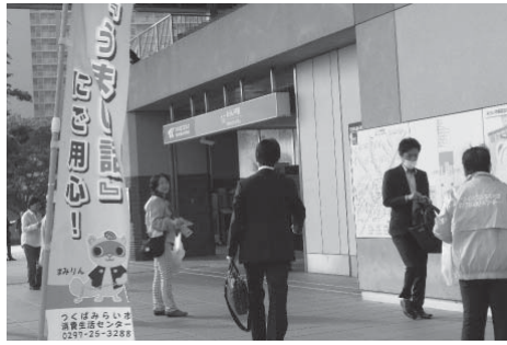
キャンペーンの様子

5月の消費者月間にあわせ、5月18日の早朝、つくばエクスプレスみらい平駅前で、被害防