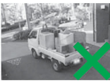
トラック型不用品回収

不用になった家電製品を処分するときは、廃棄物処理法の許可を得ない無許可の不用品回収業者には、依頼しないでください。