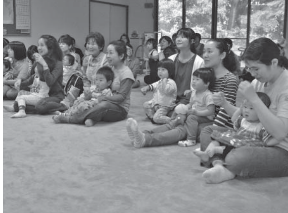
パネルシアターに見入る参加者の親子