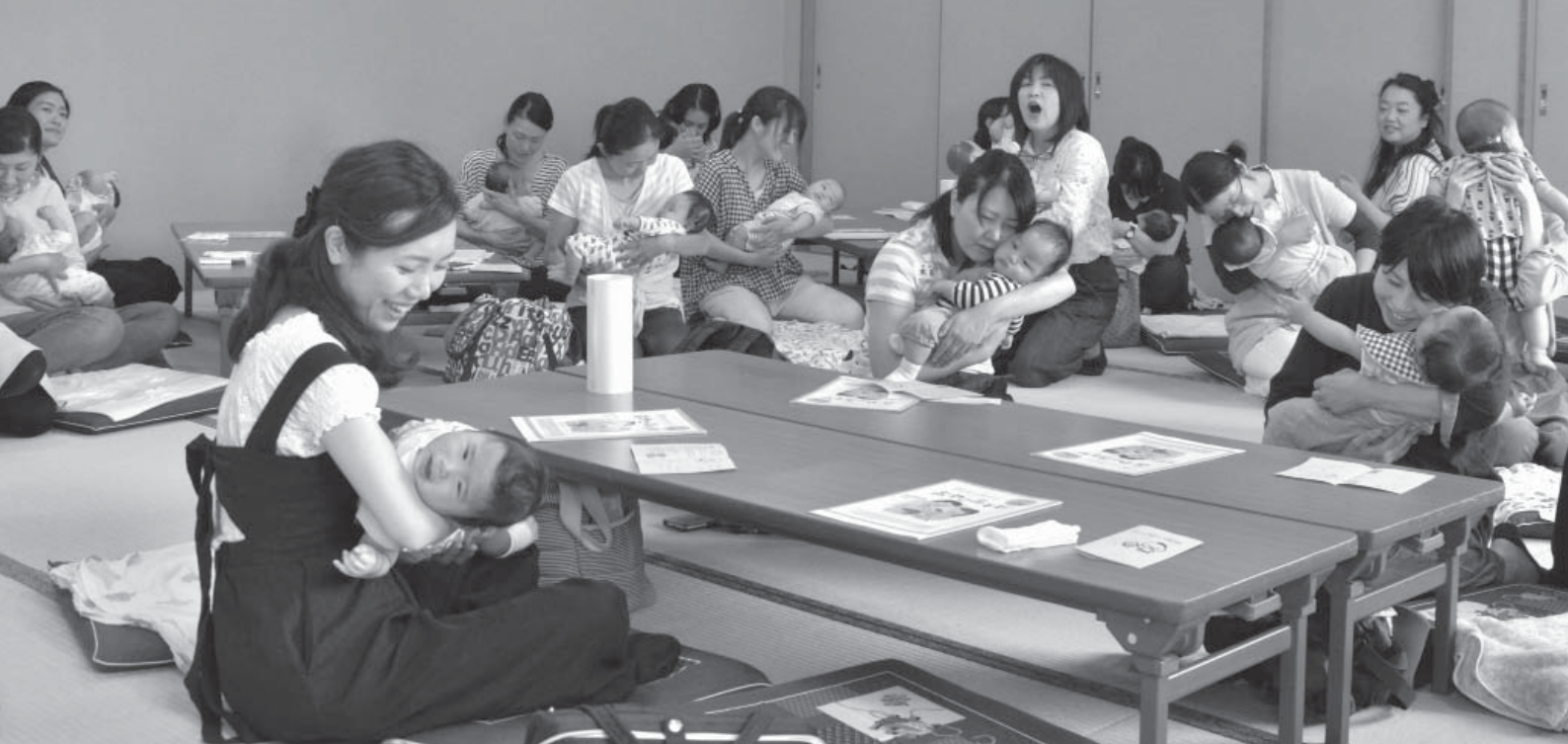
リラックスした表情で、子どもとのふれあいを楽しむ参加者