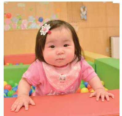
小絹児童館で楽しく遊ぶ姿を、パチリ♪