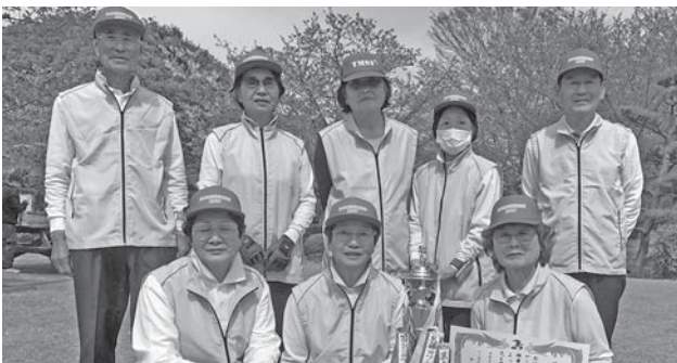
▲優勝したグリーンズチームの皆さん（市ゲートボール選手権大会）

▶期日：4月16日(日) ▶場所：きらくやまふれあいの丘ゲートボール場 ▶参加チーム数：6チーム ▶大会結果：優勝…グリーンズチーム／準優勝…高波チーム／3位…板橋チーム