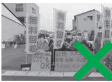
拠点型不用品回収