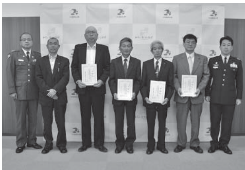
△委嘱状を手にする自衛官募集相談員の皆さん

行う自衛官募集の広報活動への支援や、防衛意識の普及などにも貢献していただくなど、重要な役割を担われています。