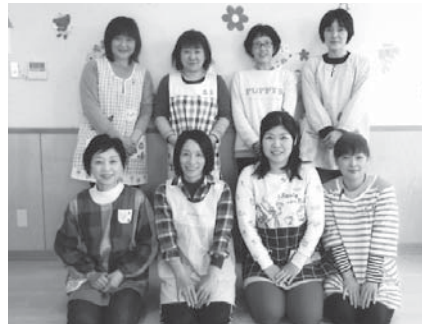
子育て支援室「フラワー」の保育士の皆さん

夢中で気がつかない。だけど、話すだけで、共感してもらえただけで、気持ちが楽になるっていう方がいっぱいいると思うので。いつ来ても、いつ帰ってもいい、実家に来るような気持ちで来てくれたら」