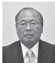
瑞宝単光章 【消防功労】

【受章者の声】このたびは叙勲の栄誉を賜り大変光栄に思っております。在職時に筑波研究学園都市の建設に携わったことが、つくばみらい市に住むきっかけとなりました。これからは、残りの人生を楽しく生きていたいと思います。