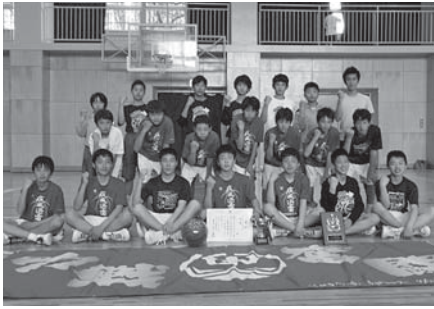
■男子バスケットボール 優勝 谷和原中学校

近隣中学校球技大会が4月29日～5月20日に開催されました。市内および近隣中学校合わせて63校1709人が参加し、熱戦が繰り広げられました。実施された競技は「ソフトテニス」「野球」「卓球」「バスケットボール」「バレーボール」の5種目で、市内の中学生が活躍し優秀な成績を収めました。