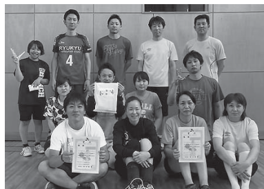
豚球会チーム、TMC(B)チームの皆さん