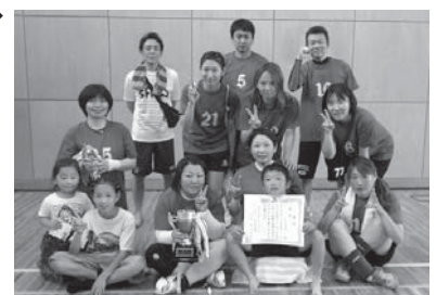
優勝したエンジェルの皆さん