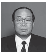
瑞宝小綬章 【厚生労働行政事務功労】

【受章者の声】このたび叙勲の栄誉を賜り、大変光栄に思っております。先輩方が残してくれた「綱火」という宝物を、次の世代に引き継いでいくため、今後も微力ながら、尽くしてまいります。