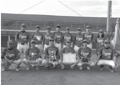
優勝した小絹 Crony の皆さん