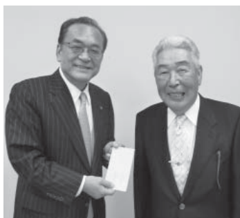
目録を手にする片庭市長と木内さん