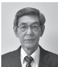
瑞宝単光章 【警察功労】

【受章者の声】このたびの叙勲に際し、図らずも拝受の栄に浴し、身の引き締まる思いでございます。この栄誉は私を指導していただきました職場の先輩、仲間、地域の皆さま方のお陰でございます。今後は健康に留意し、市勢の向上の一助になれるよう日々充実した生活に努めてまいります。