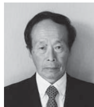
瑞宝小綬章 【北海道開発行政事務功労】

【受章者の声】このたびは叙勲の栄誉を賜り大変光栄に感じております。これもひとえに職場における上司、先輩、同僚、後輩をはじめ家族や地域の皆さまのご指導、ご協力のおかげと心より感謝しております。今後は健康に留意し、日々を家族と大切に過ごしてまいりたいと考えております。