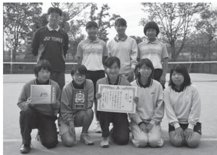
■女子ソフトテニス 第3位 谷和原中学校