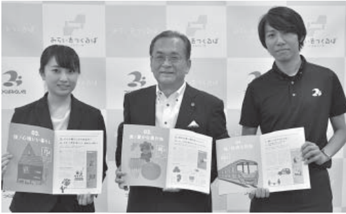
シティセールスブックを手にする片庭市長と若手職員

今年度、都内で開催するイベ ントなどを通じて、本市への移 住を促すためのツールとして活 用していきます。