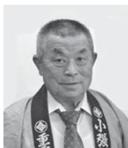
旭日単光章 【文化財保護功労】