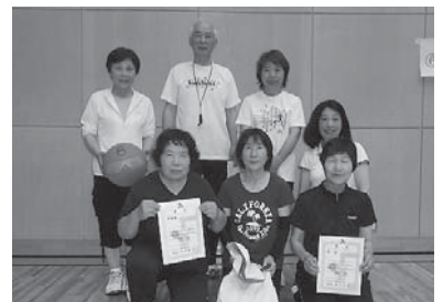
よし子さんチーム、ふくちゃんチームの皆さん