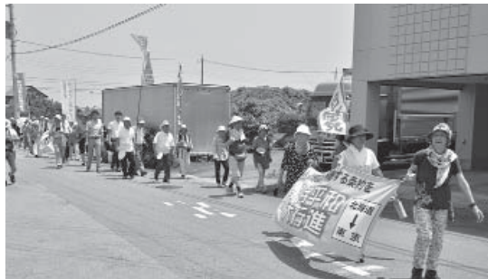
平和大行進の様子

原水爆の禁止と核兵器の廃絶 を訴える「2017年原水爆禁 止国民平和大行進」のセレモ