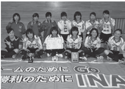
■女子バレーボール 準優勝 伊奈中学校