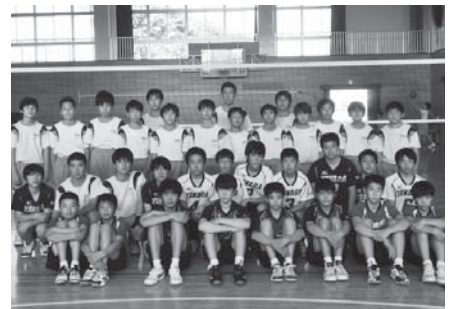
■男子バレーボール 第3位 谷和原中学校