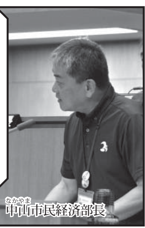
なかむら市民経済部長