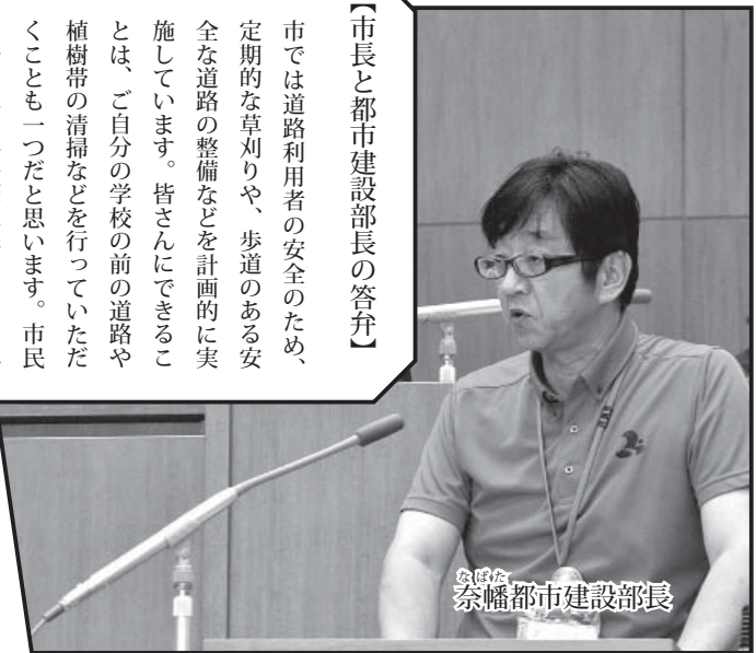
なほな 都市建設部長

【市長と都市建設部長の答弁】 市では道路利用者の安全のため、定期的な草刈りや、歩道のある安全な道路の整備などを計画的に実施しています。皆さんにできることは、ご自分の学校の前の道路や植樹帯の清掃などを行っていただくことも一つだと思います。市民の皆さんと行政が一緒になって、道路の維持管理を進めていきたいと思えます。