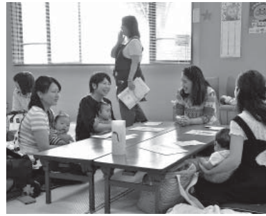
はぐはぐ教室の様子