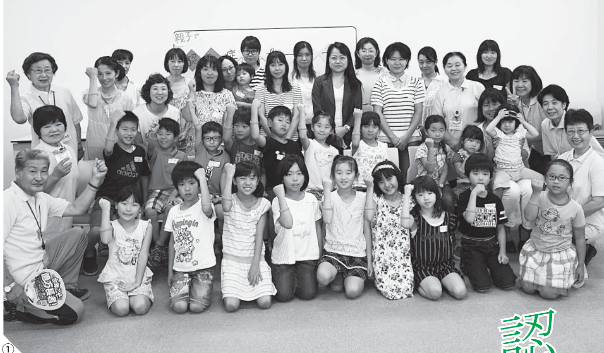
写真①親子 DE 認知症サポーター養成講座受講者の皆さん。認知症への理解の証「オレンジリング」を着用している 写真②保育所での認知症サポーター養成講座／写真③徘徊高齢者 SOS ネットワーク登録者に配布しているステッカー