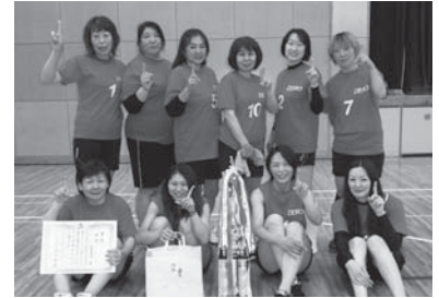
優勝した ZERO の皆さん

優勝 ZERO 準優勝 エンジェルス 第3位 Mickey 第3位 Starmine