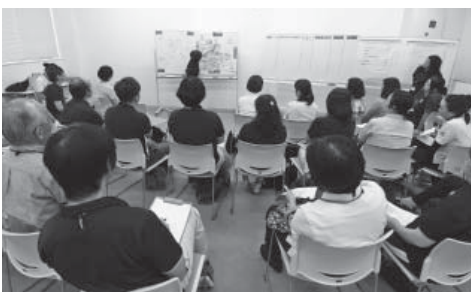
地域ケア会議の様子

地域包括支援センターでは、今年1月から半年間、市内で活躍する主任介護支援専門員の皆さんと共に勉強会を重ね、7月から「地域ケア個別検討会議」が開始しました。高齢になってもできる限り住み慣れた自宅で、今まで通り暮らしたい、その希望をつなぐ為に地域の中にある課題をみんなで話し合い、課題を解決するために意見を出し合う場が「地域ケア会議」です。