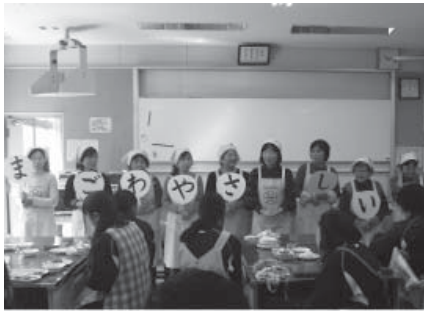
中学生を対象に行った講座の様子

▼対象者＝市内在住で、5回のうち4回以上受講できる方。 また、講座修了後に、食生活改善推進員としてボランティア活動ができる方。 ▼定員＝20人 ▼費用＝3000円（テキスト代、調理実習代など） ▼申し込み方法＝健康増進課窓口または電話でお申し込みください。 ▼申込期限＝9月22日(金) ◎午前8時30分～午後5時15分（土、日、祝日を除く）