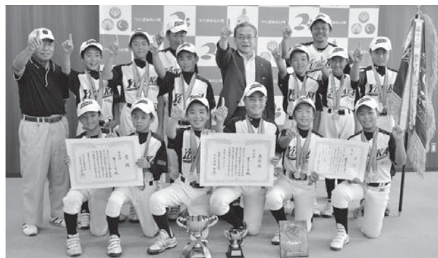
優勝した豊ナインズの皆さん