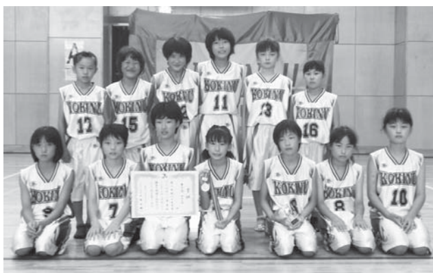
小絹 MBC ウイングスの皆さん

市ミニバスケットボール市長杯が7月29日・30日の両日、総合運動公園体育館や市内小学校の体育館などを会場に行われました。市内外から男女それぞれ24チームが参加し、熱戦を繰り広げました。その結果、当市の小絹 MBC ウイングスが、第3位に入賞する活躍を見せられました。