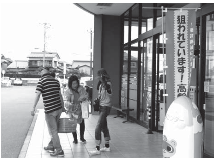
被害防止を訴える「くらしの会」の皆さん