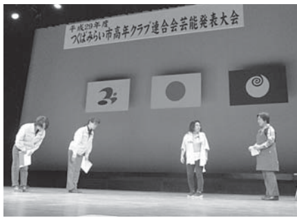
寸劇でわかりやすく注意喚起を行いました

9月18日にきらくやまふれあいの丘世代ふれあいの館で開催された「市高齢者芸能発表大会」で、住宅修理を題材にした寸劇「自己負担ゼロ!」のはずなの