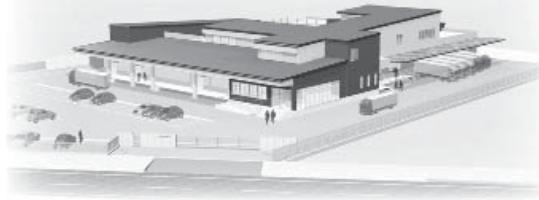
「新設学校給食センター」の完成イメージ