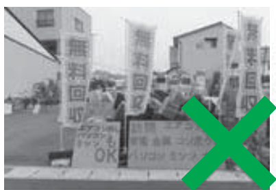
拠点型不用品回収