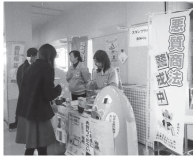
キャンペーンの様子

消費者トラブルがますます複雑化多様化し、高齢者や若者を狙った悪徳商法が多い中、アルコールパッチテストやクイズを実施しながら、被害防止を訴え