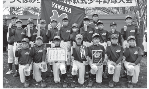
準優勝のやわらメッツの皆さん