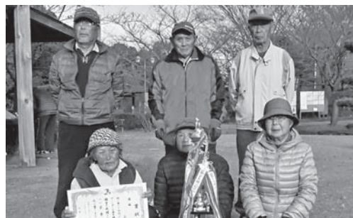
優勝した寿会の皆さん