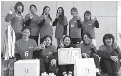
優勝したZEROの皆さん