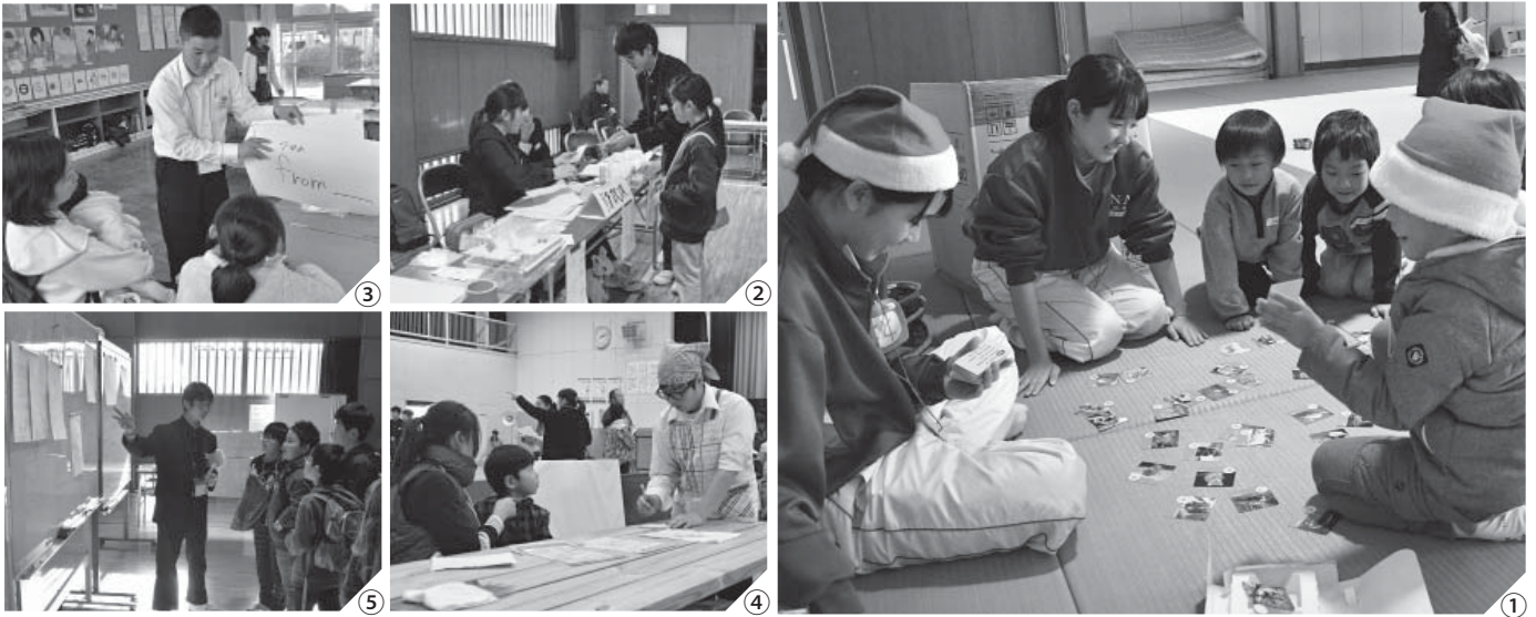
①：「保育所」で子どもたちと遊び、保育士体験／②：「市役所」に税金を納めに来た市民／③：「大学」では先生になり、英会話も教える ／④：「レストラン」でお客さんの注文を聞く店員／⑤：「市民」登録をした小学生に説明をするハローワーク職員