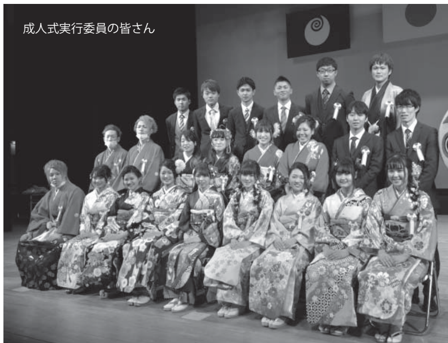
成人式実行委員の皆さん