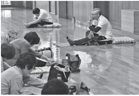
生き生きクラブの様子