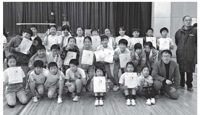
入賞した陽光台小学校5年生の皆さん