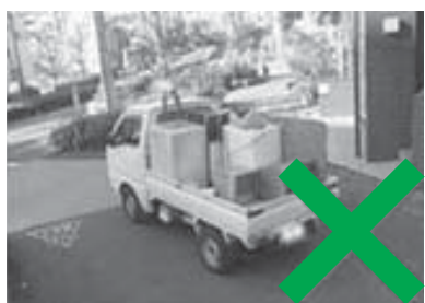
トラック型不用品回収

不用になった家電製品などを処分するときは、廃棄物の処理および清掃に関する法律の許可を得ていない無許可の回収業者に依頼しないでください。一般廃棄物収集運搬業の許可や市の委託を受けずに一般家庭や事業者から使用済みの家電製品などを戸別回収することは、法律に違反するものです。