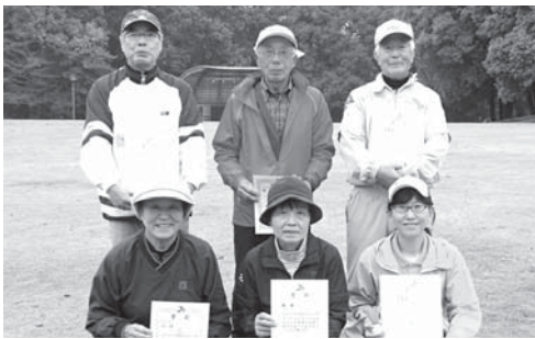
入賞した選手の皆さん