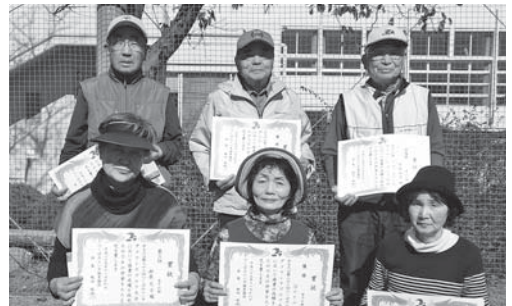
入賞した選手の皆さん