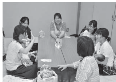
はぐはぐ教室の様子