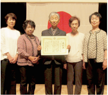
受賞したBOWベルズの皆さん