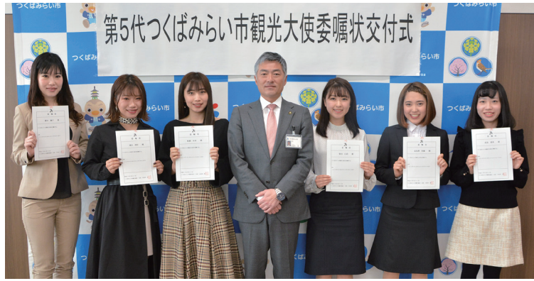
委嘱状を手にする観光大使の皆さん