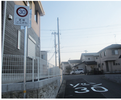
「ゾーン30」の標識と路面表示