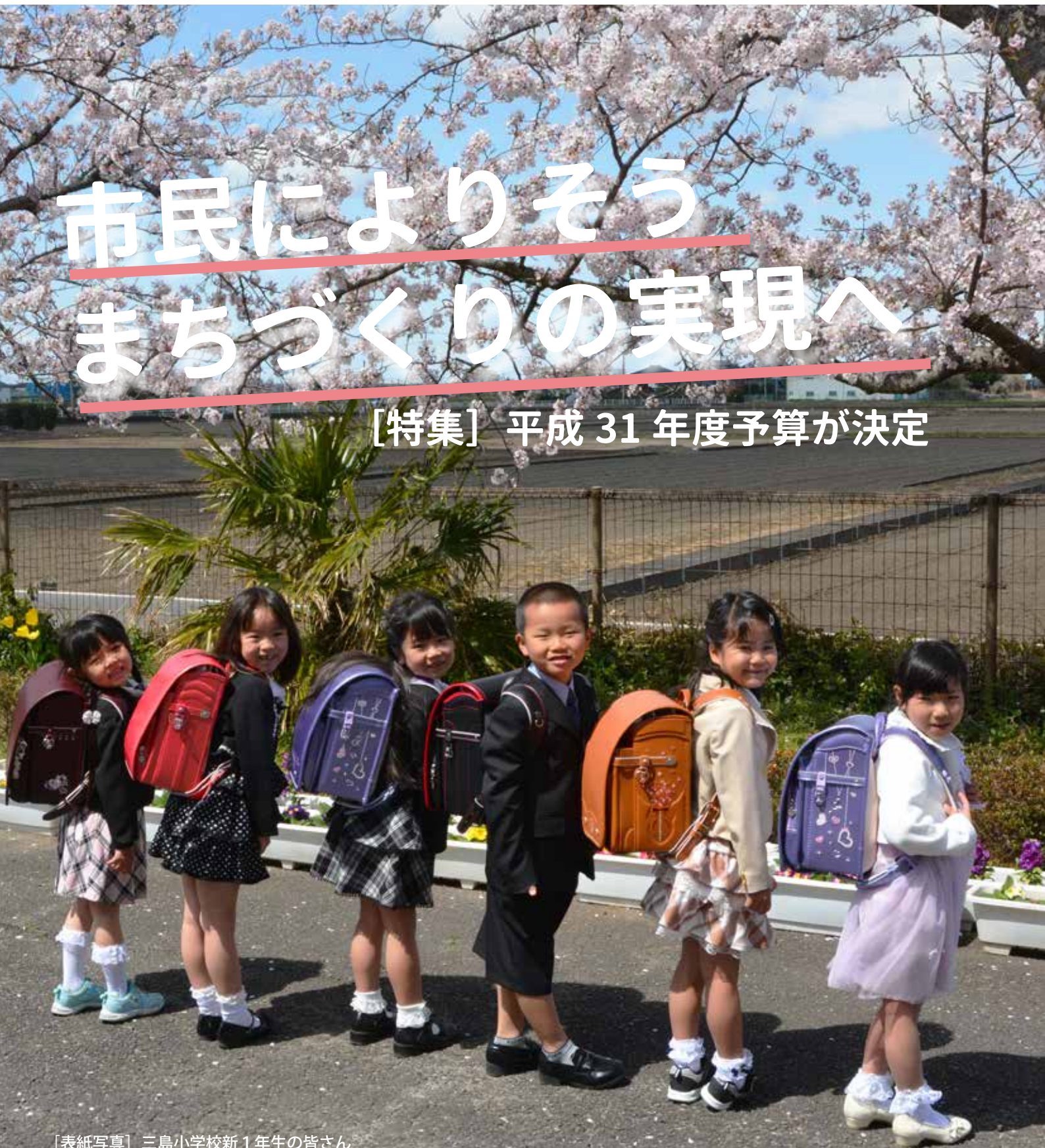
[表紙写真] 三島小学校新1年生の皆さん