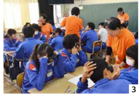
1：本市のキャラバン・メイト「認知症？伝え隊」の皆さん／2：小田川市長に活動状況を報告するキャラバン・メイトの皆さん／3：小絹中学校での講座の様子。特殊なゴーグルをかけ、高齢者の見え方を体験する生徒たち／4：親子講座の様子／5・6：保育所での講座では「子どもたちから元気がもらえる」そう。