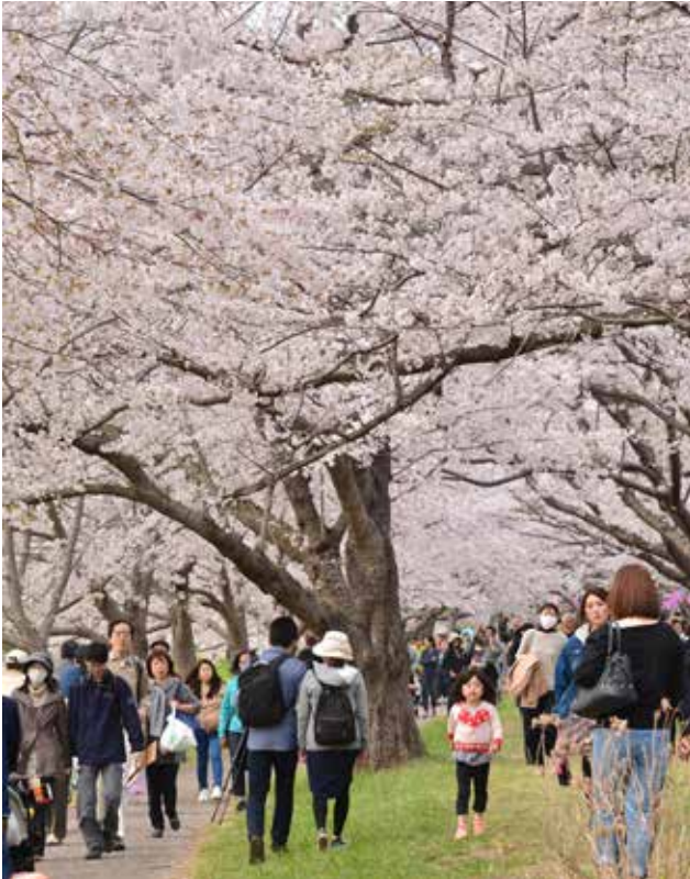
多くの花見客でにぎわう福岡堰