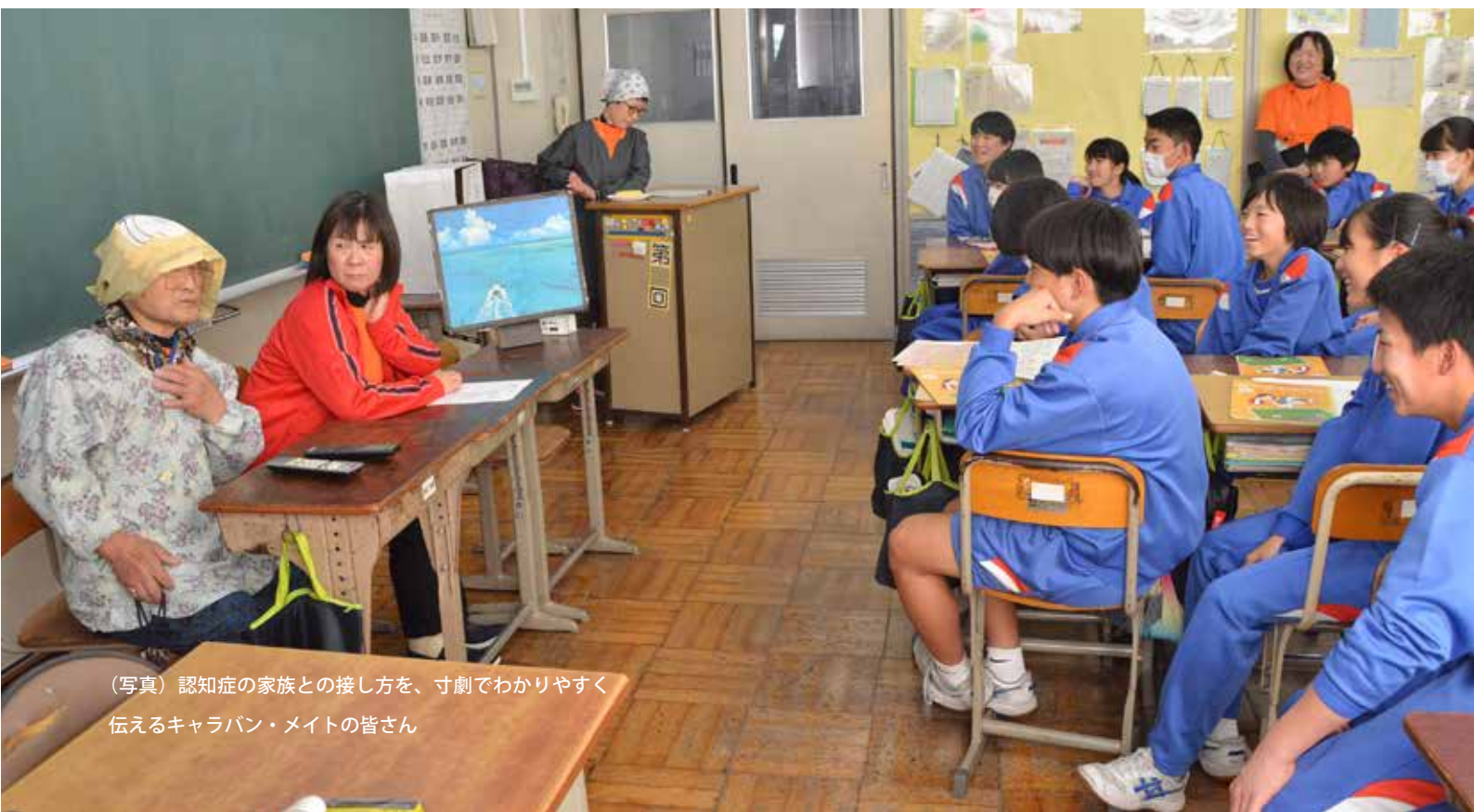
(写真) 認知症の家族との接し方を、寸劇でわかりやすく伝えるキャラバン・メイトの皆さん