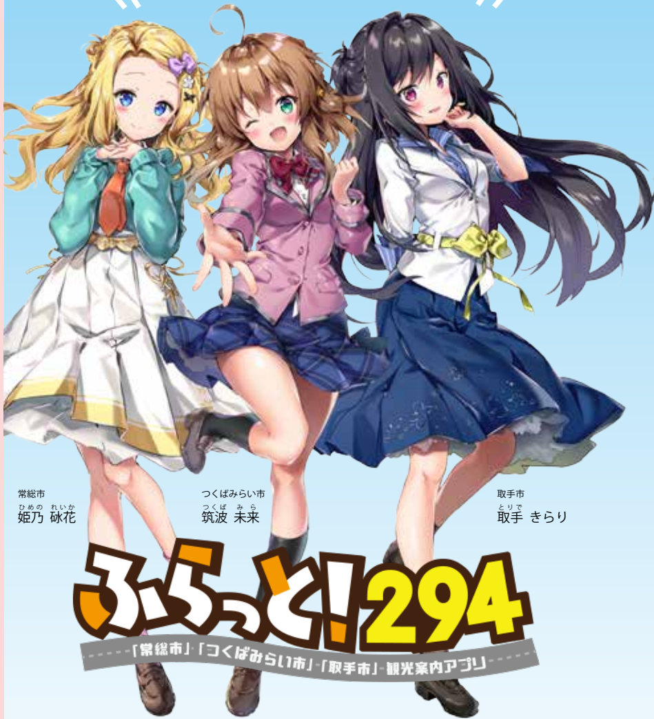
常総市 ひめの れいか 姫乃 詠花