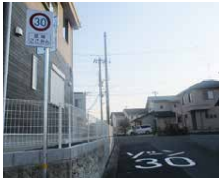
▶「ゾーン30」の標識と路面表示