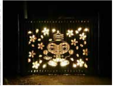
写真⑤：見事に咲き誇る桜（きらくやまふれあいの丘）、写真⑥：ボランティア「木楽工房」の皆さんによる手作りの竹灯籠（きらくやまふれあいの丘）