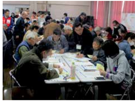
▶訓練に臨む参加者の皆さん