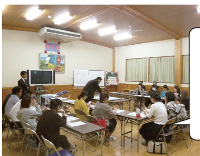
ワークショップの様子 (東小学校)

料金に関する心配やその対策、運行本数、添乗員、バス停の位置や整備などに関するご意見・ご要望を多くいただきました。