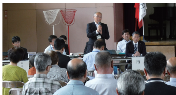
説明会当日の様子

東小学校で統合準備に関する説明会を、市長および教育長出席のもと開催しました。当日は、地域コミュニティや児童の心のケア、スクールバスの無料化・運行などについてのご意見をいただきました。説明会の状況などの詳細は、ホームページをご覧ください。