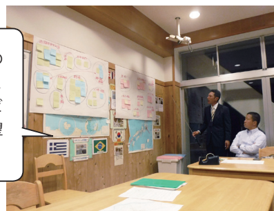
ワークショップの様子 (三島小学校)

料金に関する心配やその対策、通学路の安全対策、乗車条件や乗車場所などに関するご意見・ご要望を多くいただきました。