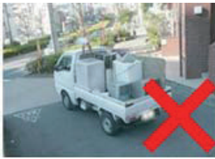
トラック型不用品回収