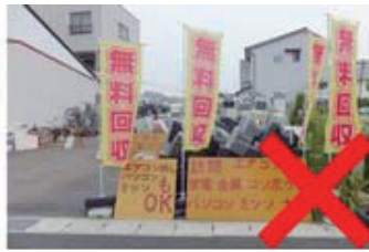
拠点型不用品回収