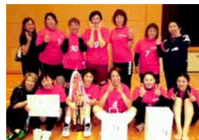
優勝した ZERO の皆さん