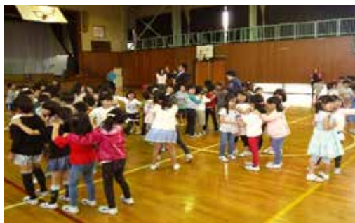
じゃんけん列車を楽しむ児童たち

今後も統合校の子どもたちが、より仲良くなれるように、交流事業を継続して実施していきます。