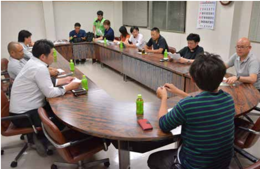
■みらいフェスタの成功に向け、企画を練る打ち合わせ。メンバーそれぞれが仕事を持っているため、開催はほとんど夜間だ。3月から何度も回数を重ね、企画を具体的な形にしていく。