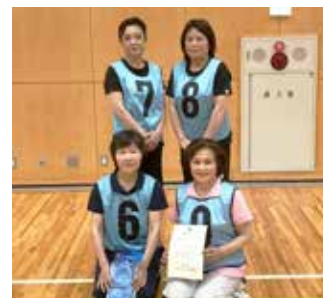
写真左：Bグループ優勝のTMC(C)／写真右：Dグループ優勝の「紫陽花」の皆さん