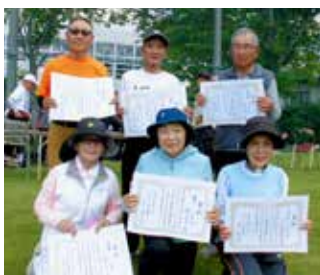
入賞した選手の皆さん