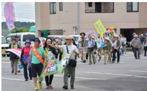
核兵器廃絶を訴え、行進する参加者

平和行進は、全国各地を11のコースでつなぎ、人々に核兵器の廃絶を訴え、今年で61年になります。