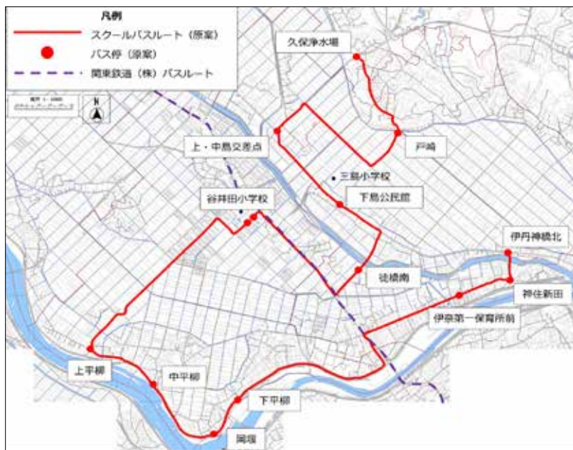
谷井田小学校・三島小学校のスクールバスルートとバス停留所の原案