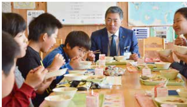
小田川市長と一緒に給食を食べる児童たち（写真は三島小学校）