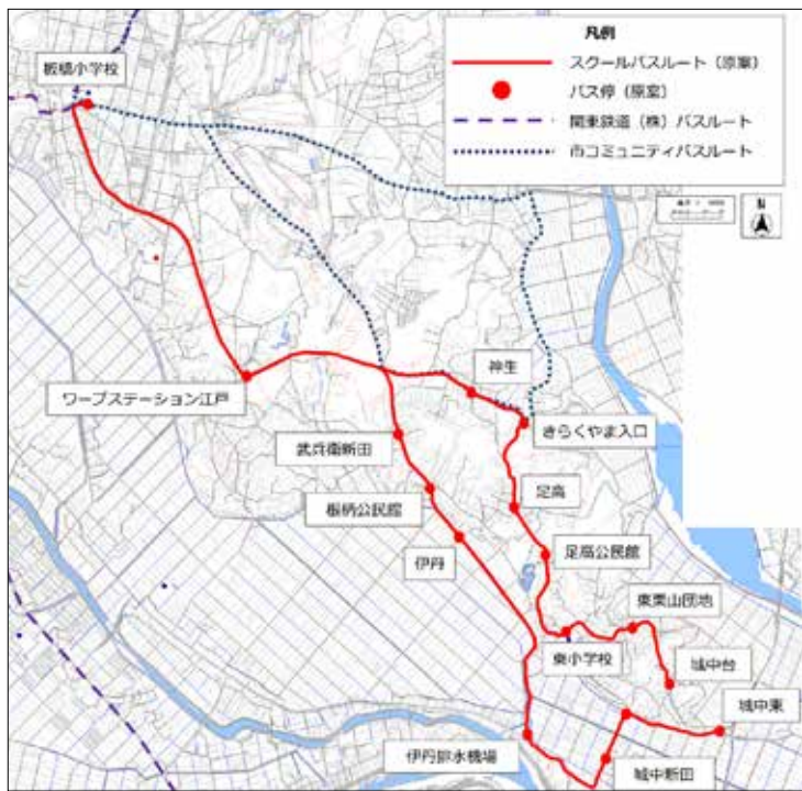
板橋小学校・東小学校のスクールバスルートとバス停留所の原案